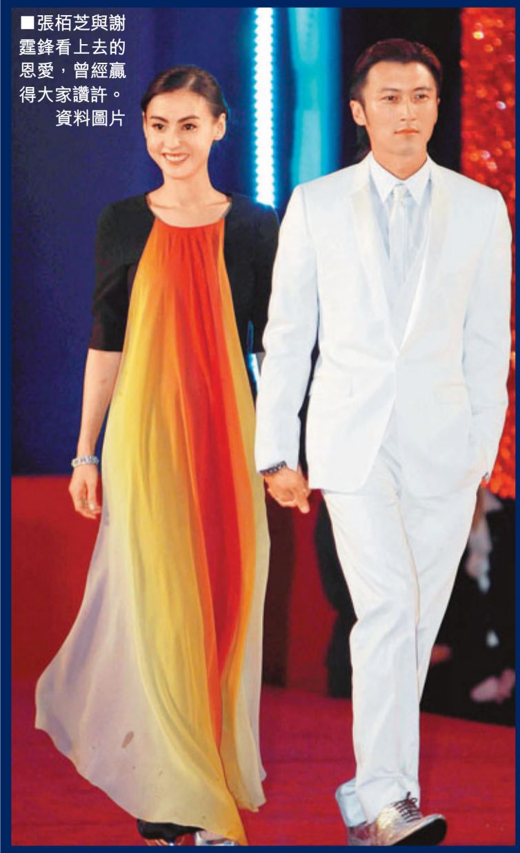
■張栢芝與謝霆鋒看上去的恩愛，曾經贏得大家讚許。