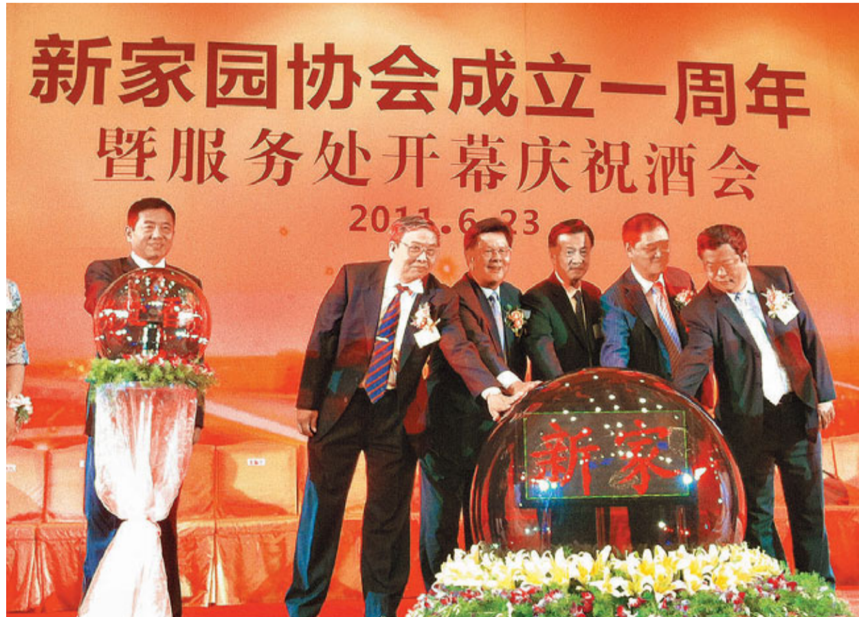
嘉賓為新家园服務處開幕作啟動儀式。

香港文匯報訊(記者 顧一丹 廣州報道)新家园協會昨在廣州舉行成立一周年暨服務處開幕慶祝活動。香港中聯辦副主任周俊明，特區民政事務局長曾德成出席。會長許榮茂表示，協會一年來為新來港人士提供了多方面的協助。協會在廣州、深圳、泉州的服務處已經開幕，還要在上海、廣西等新來港人士多的地區設立服務處。