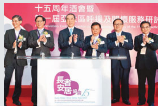
唐英年出席長者安居協會成立15周年活動。