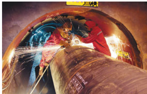
西氣東輸二線亦將於本月30日全線投產。