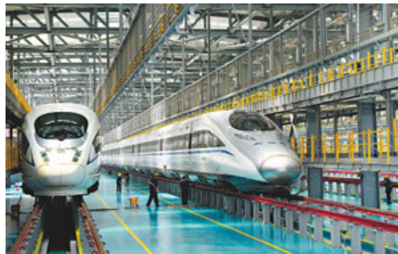
京滬高鐵將於本月30日15時正式通車。新華社

不僅如此，西二線貫通後，還將令天然氣在中國一次能源消費中的比重提高1至2個百分點，每年替代7,680萬噸煤炭，可減少二氧化碳排放1.3億噸、二氧化硫144萬噸、粉塵66萬噸、氮氧化物36萬噸。據統計，截至6月13日，西氣東輸二線已接輸中亞天然氣106億立方米，中國已有超過1億人口開始受益。