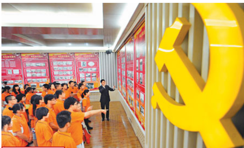
紅色教育基地 23日，「生命之光」紅色教育基地暨中共吉林省委黨史研究室黨史教育基地在長春吉林農業大學揭牌，為黨的90歲生日獻上了一份厚禮。新華社

另據中新網報導，中宣部副部長、新聞發言人王曉暉昨日在談及學習型黨組織建設工作進展時表示，各地各部門探索靈活多樣的學習方法，構建多層次、多樣化的學習載體和平台，「唱讀講傳」等品牌有效激發了黨員幹部的學習熱情和學習興趣。