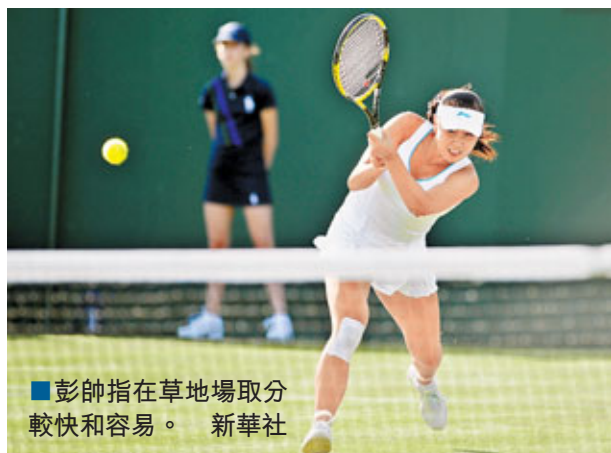
彭帥指在草地場取分較快和容易。