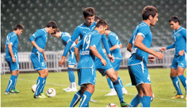
連日大雨令這場烏茲別克最終也獲准在香港大球場操練。

香港文匯報訊（記者 潘志南、郭正謙）天助港隊強襲烏茲別克！在倫敦奧運次圈外圍賽首回合客落後0:1的香港奧運代表隊，今晚8時將於香港大球場再戰烏茲別克，教練潘文迪表示兩戰不利客隊發揮，將會擺出進攻姿態撲擊烏茲別克，希望藉主場之利上演絕地反擊。門票分收60元、長者及學生特惠票20元兩種。