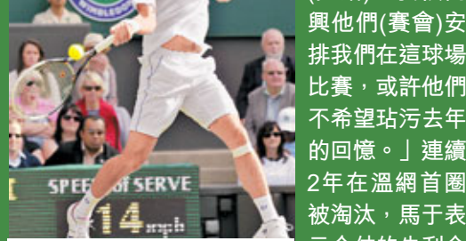
祖高域走出連勝紀錄被中止的陰霾，在溫網重回勝軌。美聯社