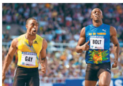
基爾(左)要向保特一雪前恥。

已屆36歲的巴西女泳手摩連拿因未能通過藥檢，將被罰停賽2個月，這意味著該名老將無緣參加下月在上海舉行的世錦賽。另外，日前宣布在世錦賽挑戰男子100米自由泳的韓國泳星朴泰桓，坦言能夠躋身決賽已感滿意。