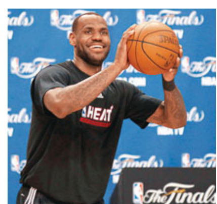
占士要加強中距離跳投。資料圖片

熱火在剛過去的球季被寄予厚望，結果與總冠軍擦肩而過，球隊主席兼名入堂級主帥萊利周二在邁阿密為球隊作球季總結時，重申不會出山重執教鞭，並表示全隊非常認同少帥斯波爾斯特拉的領導能力。