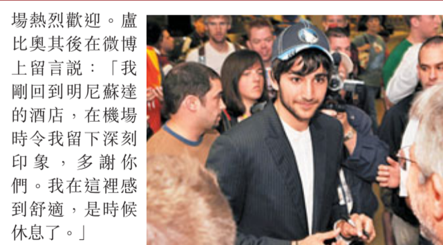
盧比奧受到球迷熱情歡迎。

木狼尚未成功羅致加素前，周一率先迎來另一名西班牙球星盧比奧。年僅20歲的盧比奧在2009年被木狼於首輪第5名選中後，未有即時登陸NBA，繼續待在西班牙多打2年，這名西班牙金童日前終於抵達明尼蘇達，得到約200人在機場熱烈歡迎。