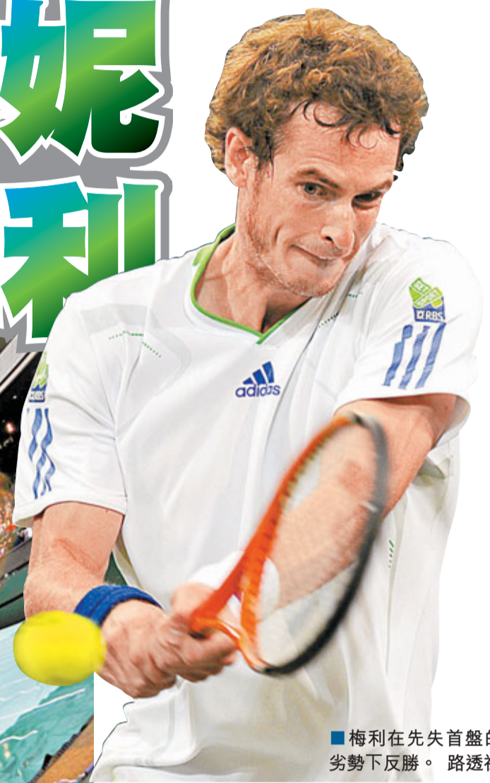
梅利在失先首盤的劣勢下反勝。

賽前的天氣預報顯示，今年的溫網多與雨水相伴，下午5時左右，充沛的雨水降臨溫布頓。在各個場地比賽的球手紛紛撤回休息室，工作人員則迅速用塑膠布遮起草場。眼見雨久沒有停下，中央場的頂棚在20分鐘後緩緩合起，經過一陣等待，激戰至決勝盤的意大利女將舒夏禾妮和澳洲球手杜姬返回中央場開戰，其他球場則只能保持「沉寂」。