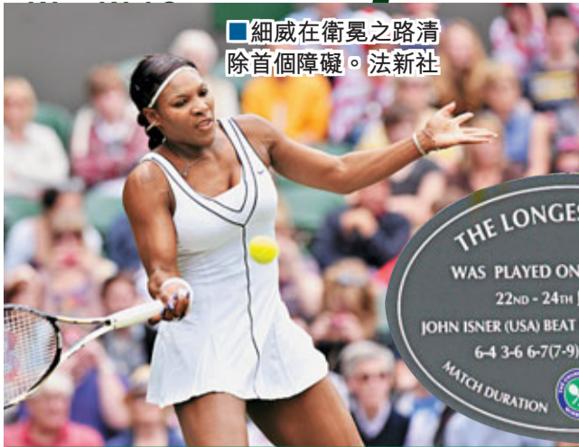
細威在衛冕之路清除首個障礙。