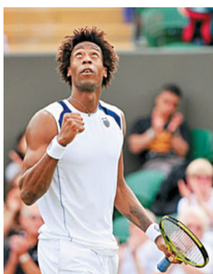
蒙菲斯在首圈輕鬆過關。