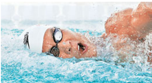
朴泰桓最近在100米自由泳常有好成績。資料圖片

朴泰桓的經紀公司稱，最近一段時間在100米自由泳上的勝利，使得朴泰桓對自己在這個距離上的期望有所提升。在17日進行的美國游泳大獎賽系列賽聖克拉拉站比賽中，朴泰桓獨攬男子100米和400米自由泳2枚金牌，其中在100米自由泳中更是力壓奧運會「八金王」菲比斯奪冠。