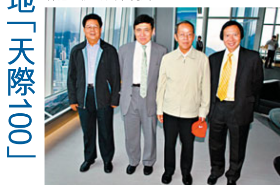
■國務院港澳辦主任王光亞在新鴻基地產副主席兼董事總經理郭炳江(右1)及郭炳聯(左2)、中聯辦副主任周俊明(左1)陪同下，參觀「天際100」。

各局長分別在觀景台向王主任重點介紹香港整體規劃，包括發展岩洞增加土地供應、廣深港高速鐵路香港段、西九文化區等設施。黃振華對王主任到訪「天際100」深表榮幸，他說：「『天際100』提供了一個極佳的平台，讓大家可以在393米高空，360度全方位鳥瞰維港景致。自從今年4月啟用至今，已吸引不少知名人士到訪，於『天際100』盡覽香港悅目景色，以最短時間從不同角度了解香港整體的城市規劃。」