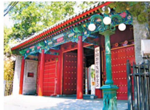
■現為中國教育發展基金會的鄭親王府。

緣起：西單大木倉胡同是清朝鄭親王府所在地，當年的鄭王府花園號稱「京城第一」，民國時，孫中山創辦的中國大學買下鄭王府辦學。中國大學擁有優良的革命傳統，李大釗曾在此教授政治經濟學，中國大學還培養了李兆麟、白乙化等抗日名將。解放後，鄭親王府成了教育部所在地。