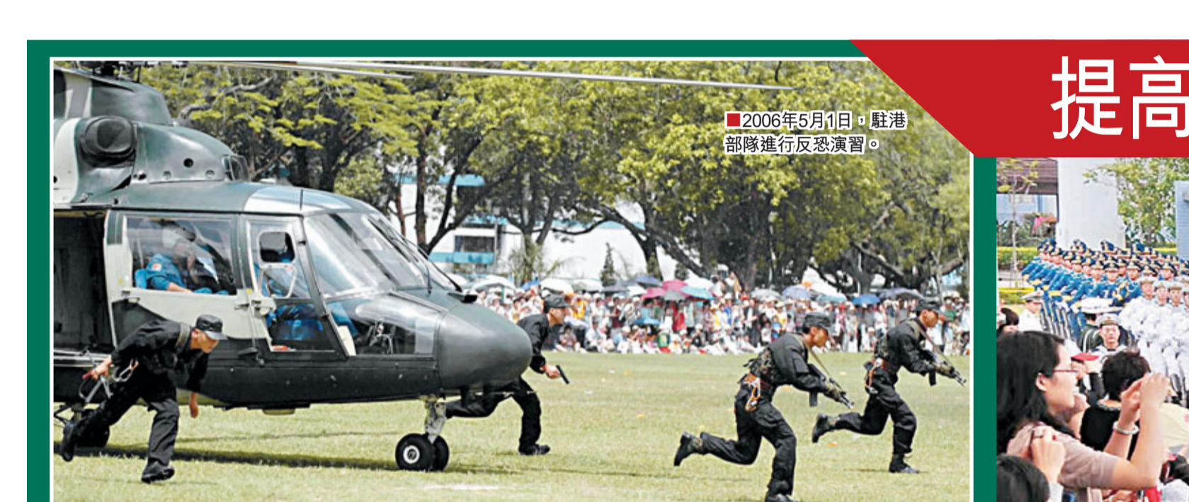
2006年5月1日，駐港部隊進行反恐演習。

官兵訓練有素 贏盡港人心 在近年駐港部隊的軍營開放活動中，最吸引香港市民的是新式武裝裝備展示，博得掌聲最多的是軍事課目表演，給市民留下最深刻印象的是軍事體驗項目。市民們參觀後紛紛表示，「有這樣訓練有素的解放軍保衛香港，我們覺得心裡很踏實！」 同台競賽 技高一籌 2005年的一個夏日，維多利亞港波濤洶湧，風急浪高，一場強颱風即將襲港。應香港特區政府的邀請，駐港部隊與美國等7個周邊國家和地區的地區軍隊同台競技，參與海上空難聯合搜救演習。「砰……」隨著指揮員的發令槍響，駐港部隊的直升機，如鷹隼般騰空而起，在離海面40米的高度俯衝、躍飛、盤旋，做着各種高難度的扇面和蛇形搜索動作。「報告指揮官，發現目標！」37分鐘後，駐港部隊的參直直升機率先發現目標，準確報告位置。見此場景，參加演習的美軍指揮官興奮地喊道：「Excellent! (漂亮)」