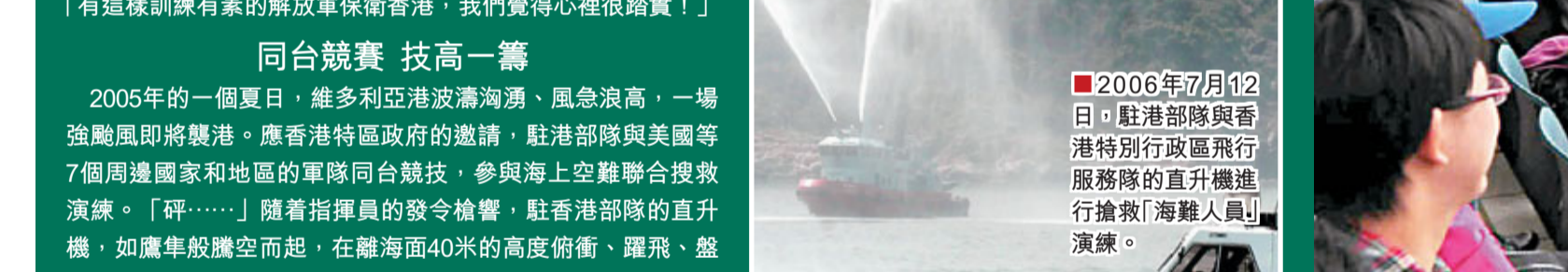
2006年7月12日，駐港部隊與香港特別行政區飛行服務隊「海難人員」演習。

官兵訓練有素 贏盡港人心 在近年駐港部隊的軍營開放活動中，最吸引香港市民的是新式武裝裝備展示，博得掌聲最多的是軍事課目表演，給市民留下最深刻印象的是軍事體驗項目。市民們參觀後紛紛表示，「有這樣訓練有素的解放軍保衛香港，我們覺得心裡很踏實！」 同台競賽 技高一籌 2005年的一個夏日，維多利亞港波濤洶湧，風急浪高，一場強颱風即將襲港。應香港特區政府的邀請，駐港部隊與美國等7個周邊國家和地區的地區軍隊同台競技，參與海上空難聯合搜救演習。「砰……」隨著指揮員的發令槍響，駐港部隊的直升機，如鷹隼般騰空而起，在離海面40米的高度俯衝、躍飛、盤旋，做着各種高難度的扇面和蛇形搜索動作。「報告指揮官，發現目標！」37分鐘後，駐港部隊的參直直升機率先發現目標，準確報告位置。見此場景，參加演習的美軍指揮官興奮地喊道：「Excellent! (漂亮)」