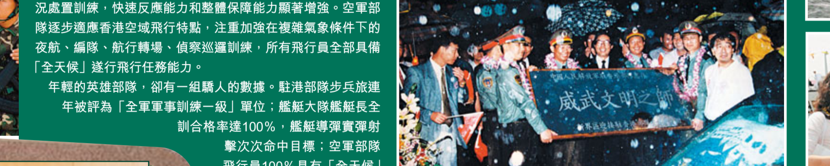
1997年7月1日凌晨，新界區各界代表冒著傾盆大雨歡迎駐港部隊的到來，並把刻有「威武文明之師」字樣的牌匾獻給駐港部隊官兵。

艱苦訓練 成績驕人 作為一支陸海空三軍合成的部隊，駐軍的訓練緊圍繞特殊的使命課題展開。陸軍部隊在強化基礎訓練和適應性訓練的基礎上，着力抓好警衛、巡邏、應急機動和城市勤務等針對性訓練，列裝的各種新裝備全部形成戰鬥力。海軍部隊突出香港海區知識的學習和實戰訓練，加強海上巡邏、搜索打撈、意外情況處置訓練，快速反應能力和整體保障能力顯著增強。空軍部隊逐步適應香港空域飛行特點，注重加強在複雜氣象條件下的夜航、編隊、航行情場、偵察巡邏訓練，所有飛行員全部具備「全天候」遂行飛行任務能力。 年輕的英雄部隊，卻有一組驕人的數據。駐港部隊步兵旅連年被評為「全軍軍事訓練一級」單位；艦艇大隊艦艇長全訓合格率達100%，艦艇導彈實彈射擊致命命中目標；空軍部隊飛行員100%具有「全天候」遂行飛行任務的能力。