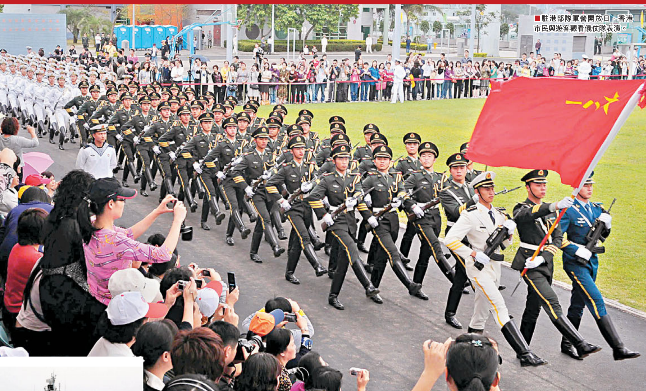
駐港部隊軍營開放日，香港市民與遊客觀看儀仗隊表演。

今年7月1日，中國人民解放軍駐香港部隊進駐香港履行防務整整14年。作為「一國兩制」的實踐者，駐港部隊走過了不平凡的歷程。駐港部隊近年來多次成功組織海空巡邏、海空難搜救演練、諸軍兵種聯合演習、跨營區機動演練等軍事活動，大力提高遂行多樣化軍事任務能力，實現了由「形象代表隊」向「戰鬥代表隊」的轉變。