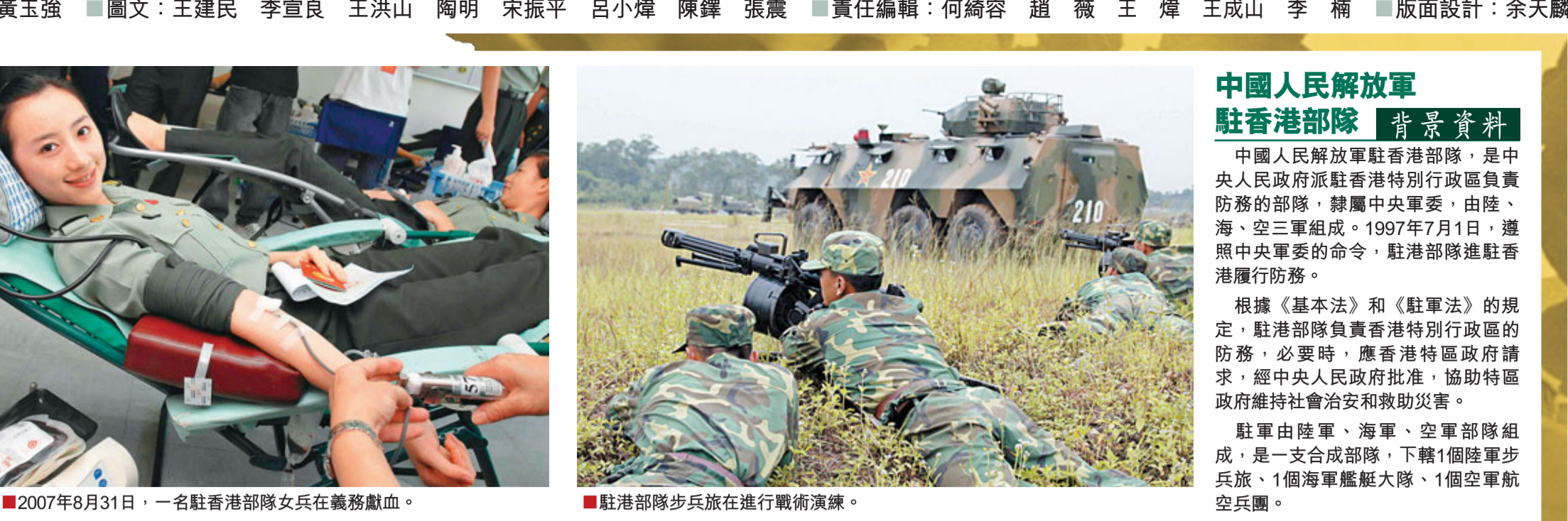
2007年8月31日，一名駐香港部隊女兵在義務獻血。

堅持「不干預有作為」原則 近年來，駐港部隊按照「不干預、有作為」的原則，一方面請香港各界人士進營參觀走訪，加強國防知識普及，提升他們的國防觀念，進而增強國家和民族意識；另一方面發揚愛民傳統，通過各種方式走出軍營，參加各種公益活動，主動融入香港社會，讓駐軍官兵成爲建設香港的一分子。 14年來，我們通過組織軍營開放、組織參加植樹造林、參與組織香港青年軍軍事夏令營、與香港大學生互訪聯誼等活動，逐步加深駐軍官兵與香港市民的相互了解，增進彼此友誼，爲我們在香港履行防務創造了良好和諧的外部環境。 我們希望通過不斷地努力，進一步加深香港同胞對駐軍的認同，進而轉化爲對祖國和民族的認同，真正實現「一國兩制」條件下的「一國一心」。(文字摘自《解放軍報》2011年5月24日第2版)