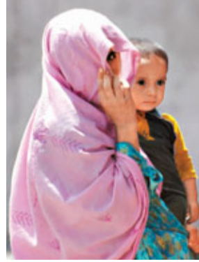
■一對阿富汗母子在巴基斯坦避難。

昨日是世界難民日，聯合國難民事務高級專員公署(UNHCR)公布，截至去年底全球共有4,370萬名難民、尋求庇護者和流離失所的人，比前年增加30萬人，創15年來新高。當中有80%難民身處發展中國家，為這些國家帶來沉重經濟壓力。此外，聯合國估計，全國第70個嬰兒將在10月31日誕生。