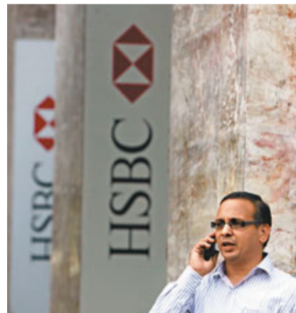
■匯控料將與其他銀行爭奪印度客戶。

印度政府經多年反對後終於開綠燈，准許該國工業集團參與利潤豐厚的零售銀行業，據悉印度儲備銀行及央行已批准這些集團申請銀行執照，預料在印度經營零售銀行的匯控、花旗等外資大行，將面對更激烈的競爭。