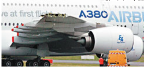
■A380機翼留下撞損的傷口。