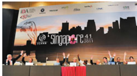
■ICANN成員投票通過了新域名方案。