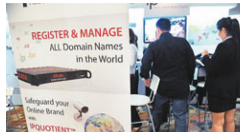
■提供域名註冊的公司，將給客戶更多選擇。