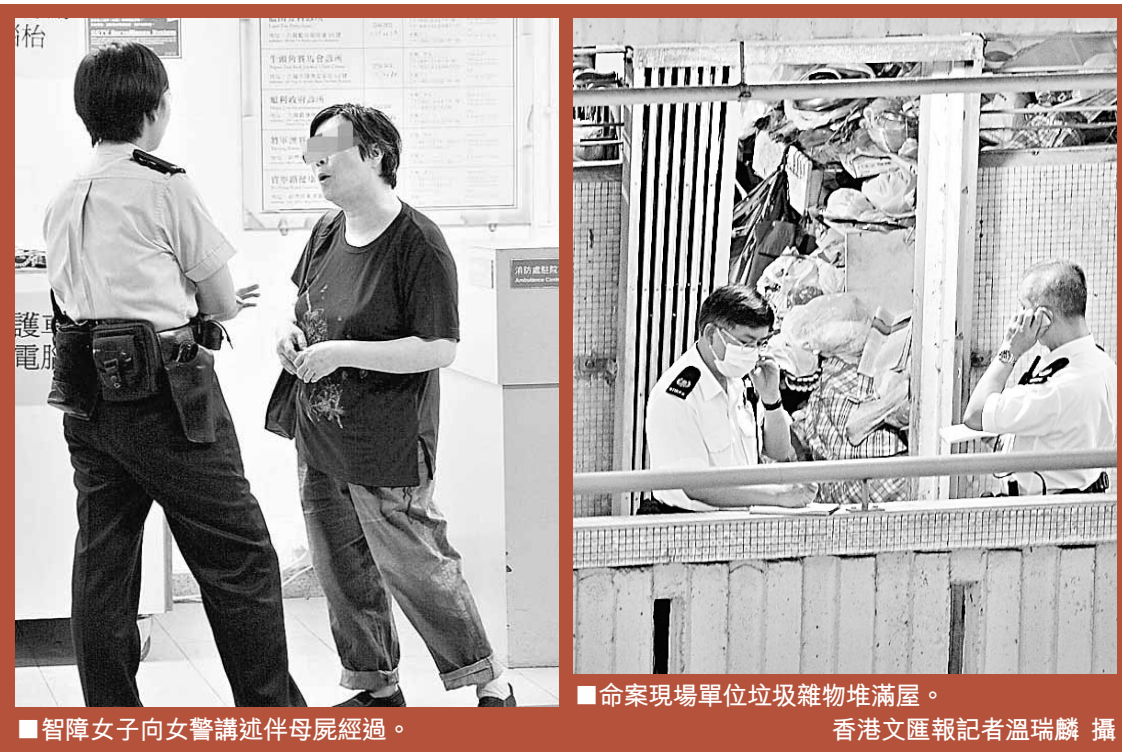
智障女子向女警講述母屍經過。命案現場單位垃圾雜物堆滿屋。