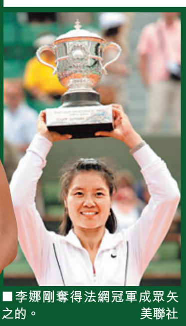
李娜剛奪得法網冠軍成眾矢之的。

溫網組委會公佈了2011年溫網男女單打的32位種子名單。2011年法網冠軍李娜憑借近期優秀的表現再創新高，原本位列賽事女子4號種子，但是由於克利施特絲臨時退賽，因此李娜得以升至第3。彭帥也創個人最佳成為20號種子。去年的溫網衛冕冠軍拿度順利成為男單頭號種子，接下來男子2至4號種子則是祖高域、費達拿以及梅利。女單頭號種子則為禾絲妮雅琪。除此之外，引人注目的大威也雙雙復出，征戰本次溫網，衛冕冠軍威廉絲列7號種子，姐姐大威則是23號種子。