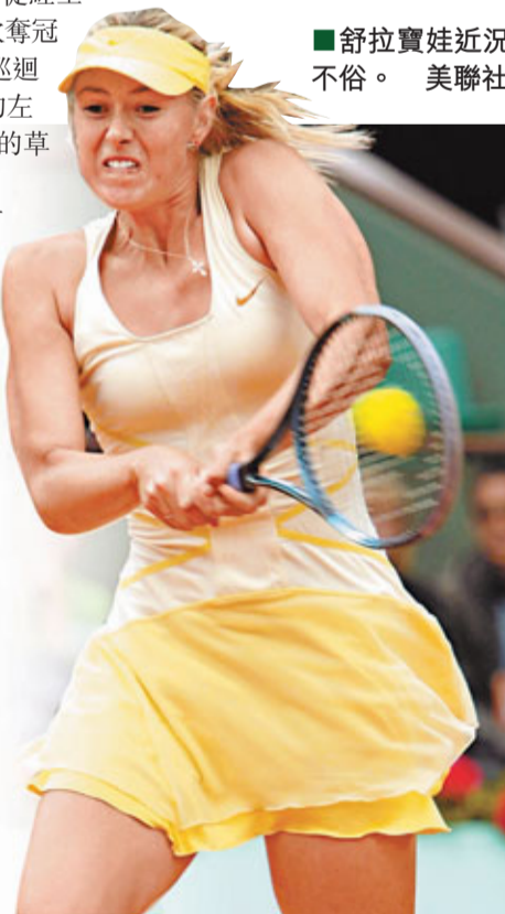
舒拉寶娃近況不俗。