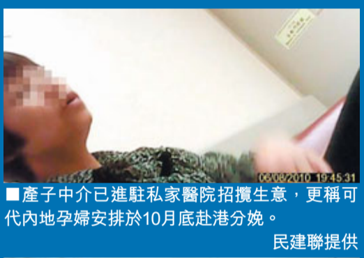
■ 產子中介已進駐私家醫院招攬生意，更稱可代內地孕婦安排於10月底赴港分娩。