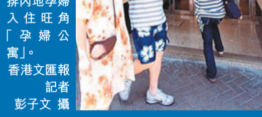
■ 圖為疑是產子中介安排內地孕婦入住旺角「孕婦公寓」。