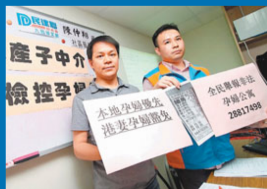
■ 民建聯近日接獲最少10宗「孕婦公寓」投訴。圖左為立法會議員陳克勤，右為民建聯紅磡總幹事陳仲翔。

入境處就此回應，指當局一直關注辦事處的排隊秩序，並已實行一系列措施優化排隊安排，當中包括為排隊人士登記姓名或證件號碼，並於辦證時核對以防止買賣情況，並呼籲辦證人士先於網上預約，處方強調措施已有效改善排隊及派籌的安排和秩序。