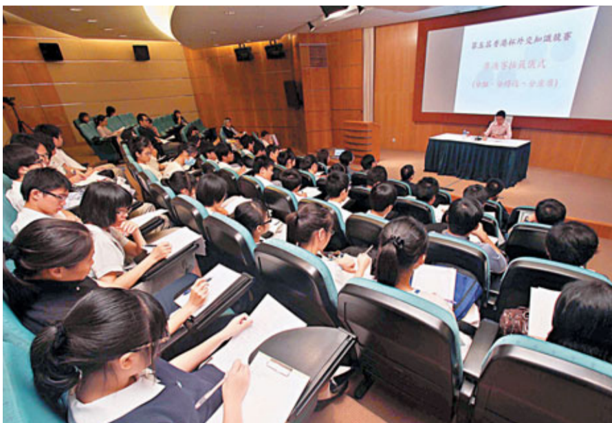
「第五屆香港杯外交知識競賽」的16間中學出線隊伍，昨到外交部駐港特派員公署進行賽前培訓。