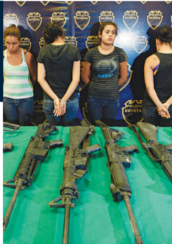
被捕的少女中2人未成年，被警方要求面壁以免「露面」。路透社

阿爾法羅表示，年青毒販絕對是「初生之犢不畏虎」，會拚死接受高危險任務。數據顯示，他們往往在3至4年內「殉職」。墨西哥未能建立完善司法制度作阻嚇，亦無創造足夠「正行」職位，殺手成為年青人的夢想工作。在惡性循環下，該國高謀殺率自然不能解決。該國兒童權利網絡表示，現時約有3萬名年青人為罪犯工作，直接導致國內輟學問題嚴重。但學校也不見得是安全地，政府2009年調查5.5萬名學童，發現超過1/5人見過同學帶武器上學，1/8人會在學校交易大麻。路透社