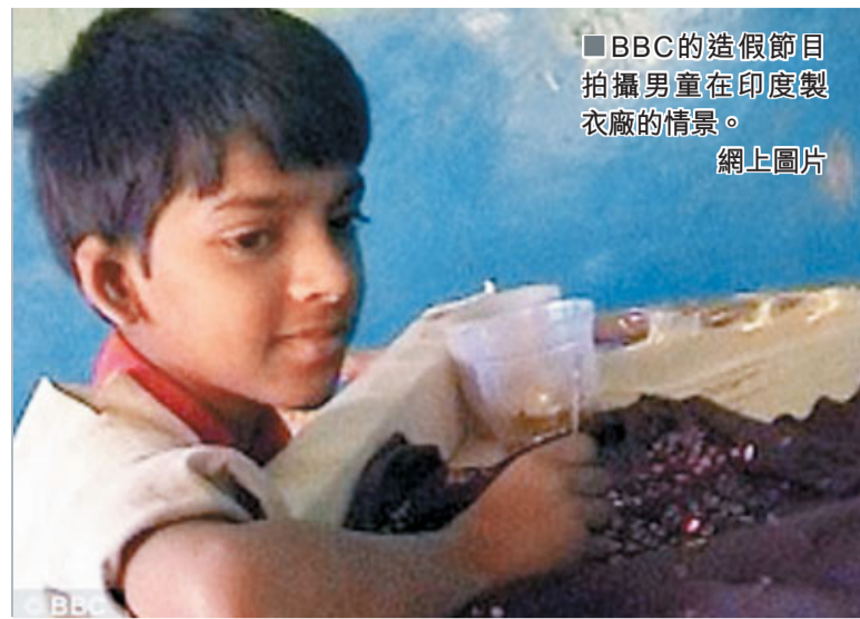
■BBC的造假節目拍攝男童在印度製衣廠的情景。

英國廣播公司(BBC)一個2008年節目被揭發造假，英國製衣公司Primark被節目指於印度以童工製衣，多年來被打上「勞役童工」標籤。BBC近日被逼向Primark公開道歉，而該節目獲得的獎項或會遭褫奪。