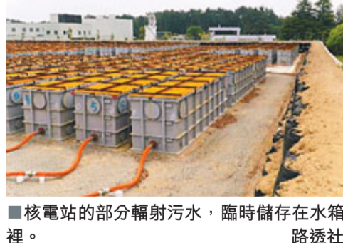
■核電站的部分輻射污水，臨時儲存在水箱裡。

東京電力公司前日在日本福島核電站啟動污水處理系統，但5小時後因輻射水平超標而暫停，須更換新組件，未知何時才能恢復。東電發言人稱，淨化系統的鈉吸附裝置達到更換標準，比預期的1個月為早，公司正調查原因。東電有官員懷疑有高輻射泥土湧進系統，或污水輻射水平較先前量度時上升。