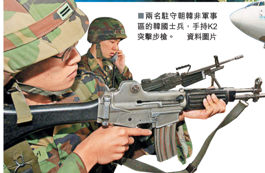
■兩名駐守朝韓非軍事區的韓國士兵，手持K2突擊步槍。資料圖片