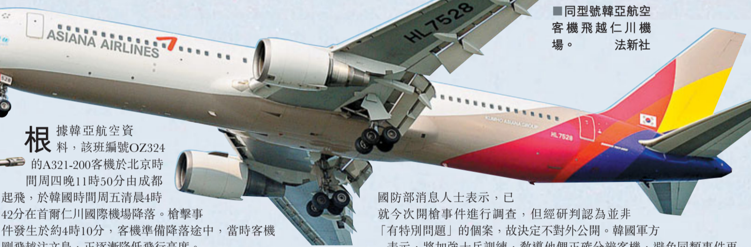
■同型號韓亞航空客機飛越仁川機場。

根據韓亞航空資料，該班編號OZ324的A321-200客機於北京時間周四晚11時50分由成都起飛，於韓國時間周五清晨4時42分在首爾仁川國際機場降落。槍擊事件發生於約4時10分，客機準備降落途中，當時客機剛飛越注文島，正逐漸降低飛行高度。