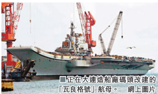
正在大連造船廠碼頭改建的「瓦良格號」航母。

文章表示,中國在巴基斯坦西部港口瓜達爾和緬甸沿海打造兩個新的海軍基地,不但使印度感到極為恐慌,甚至連美國海軍也忐忑不安。通過鐵路,這兩個分別位於阿拉伯海和孟加拉灣—恰好扼守印度洋兩翼一的港口將與中國西部連接起來。它們的成功