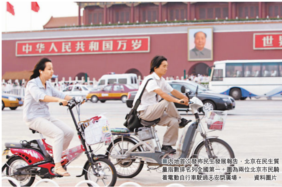
內地首次發佈民生發展報告,北京在民生質量指數排名列全國第一。圖為兩位北京市民騎着電動自行車駛過天安門廣場。

《報告》通過民生質量指數、公共服務指數和社會管理指數三大類指標,對內地除西藏外的30個省(區、市)民生發展情況進行了定量分析,呈現三大特點:一是省級民生發展區域集中度較高,大致呈現出從「東部—東北部—中部—西部」由強漸弱的階梯形分佈趨勢。二是在排名呈階梯形總體趨勢下,部分省份呈現出與其所在區域總體位次趨勢不一致的情形。三是排名表現出較強的區域經濟實力相關性,這表明「保民生」和「促發展」兩者間並不矛盾,通過轉變經濟發展方式,在發展經濟的同時,不斷保障和改善民