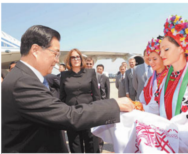
烏克蘭女青年獻上鹽和麵包,歡迎胡錦濤主席。

胡錦濤表示,雙方將全面總結建交19年來中烏關係發展成果,對下一階段兩國關係發展作出規劃,並就共同關心的國際和地區問題交換看法。我希望通過這次訪問,增進雙方相互理解和信任,把中烏關係提升到更高水平。