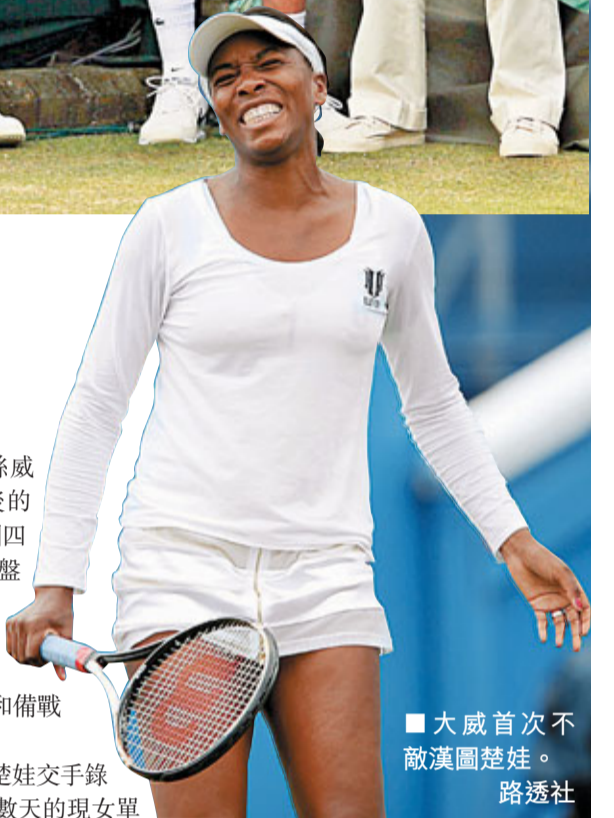
大威首次不敵漢圖楚娃。