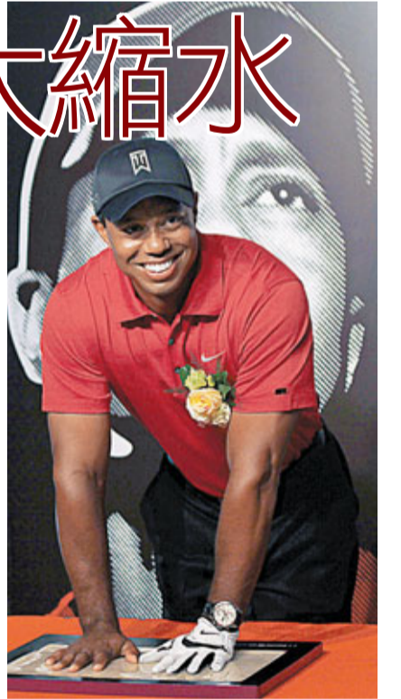
活士近年失去多個贊助商，「錢途」變得黯淡。資料圖片