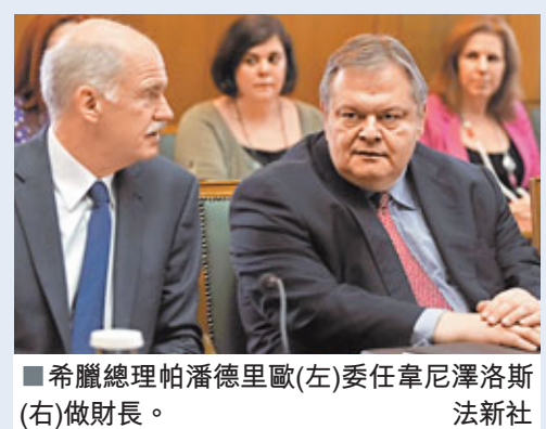
希臘總理帕潘德里歐(左)委任韋尼澤洛斯(右)做財長。

深陷債務危機的希臘昨日大幅改組內閣，財長帕帕康斯坦季努改任環境部長，外界視之為降級；他的職位由國防部長韋尼澤洛斯取代。韋尼澤洛斯是總理帕潘德里歐的黨內主要競爭對手，曾於2007年挑戰帕潘德里歐爭奪黨魁一職，分析認為帕潘德里歐此舉是要爭取黨內支持，讓國會通過緊縮政策。 韋尼澤洛斯就職後表示，希臘將會「得救」，且會向着財政目標繼續邁進。