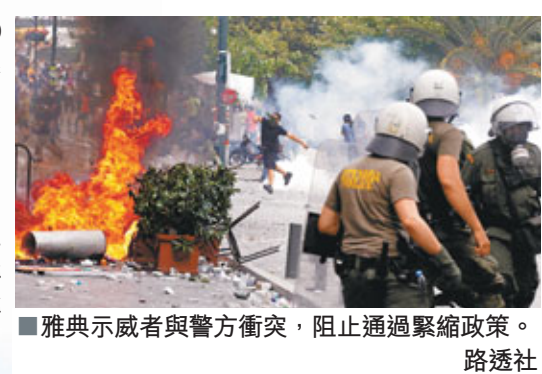
雅典示威者與警方衝突，阻止通過緊縮政策。

該筆貸款為去年歐盟和IMF的1,100億歐元（約1.2萬億港元）援希方案的一部分；如果IMF拒絕發放，希臘將於下月15日失去現金周轉。 德國在IMF作出以上威脅後10日，表態同意希臘有需要接受援助，但同時建議希臘國債的私人投資者承受損失。德國的方案引起歐盟不滿，歐元集團主席容克批評德國的方案「危險」，指3大評級機構都視此為違約。 德國的立場使它日益顯得孤立。《衛報》表示，正在布魯塞爾召開會議的高級官員和外交人員證實IMF曾作出如此威脅，並指德國已經妥協，因而歐盟和IMF已同意在下月向前向希臘發放120億歐元（約1,324億港元）的第5期貸款。 希臘總理帕潘德里歐後天將與歐盟委員會主席巴羅佐及歐元集團主席容克會面。巴羅佐昨日呼籲希臘政界支持改革，讓希臘和歐盟各自做好本分，才可保證希臘和歐洲金融穩定。 法德元首會面 尋求共識 另一方面，法國總統薩科齊昨日飛往柏林，和默克爾會面，進一步爭取對方同意新一輪援助希臘方案，預計總值達1,250億歐元（約1.38萬億港元）。然而各方仍未就方案細節達成共識，預計下周舉行的一連串會議也不會有成果，《衛報》指各方要到下月11日才能敲定方案。 即使德國同意援助，歐盟及IMF等仍會視乎希臘國會是否成功通過新一輪緊縮政策，方會再度向希臘施以援手。總理帕潘德里歐希望藉重組內閣，換取國會通過280億歐元（約3,088億港元）的加稅削支方案及500億歐元（約5,515億港元）的私有化計劃。