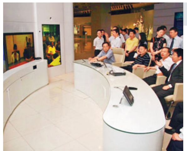
■代表團一行在華為集團總部觀摩寬帶視頻通話。

唐良智表示，武漢提出打造智慧城市的目標，隨着華為將業務從基礎通信網絡逐步拓展至雲計算和終端市場，武漢可以為華為在中部地區的發展提供良好的平台，也需要華為為打造智慧城市助一臂之力。他同時表示，武漢市可成立工作組，指定副市長掛帥為華為在武漢項目的拓展提供服務，並首先在2012年前保證為華為在武漢的快速擴張所需的辦公空間提供支持。