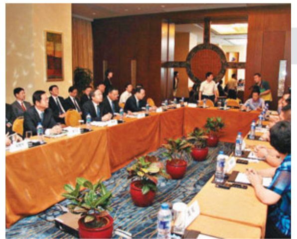
■武漢市市長唐良智與深圳市各行業協會代表座談。

張思平透露，應湖北省委書記李鴻忠的邀請，下周五他將率深圳市總商會代表團到湖北省和武漢市考察，希望在兩地政府合力搭建的平台之上，兩地企業能夠加強交流和合作，為促進兩地經濟發展做出更大的貢獻。