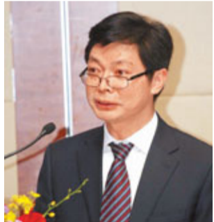
■漢陽區區長涂山峰在推介會上致辭。

香港文匯報訊(記者 鄒珍貴、俞鯤 深圳報導)武漢市漢陽區周二在深圳舉行的四新生態新城推介會暨項目簽約儀式上，該區區長涂山峰與廣東省湖北商會會長王軍華簽署戰略合作框架協議。