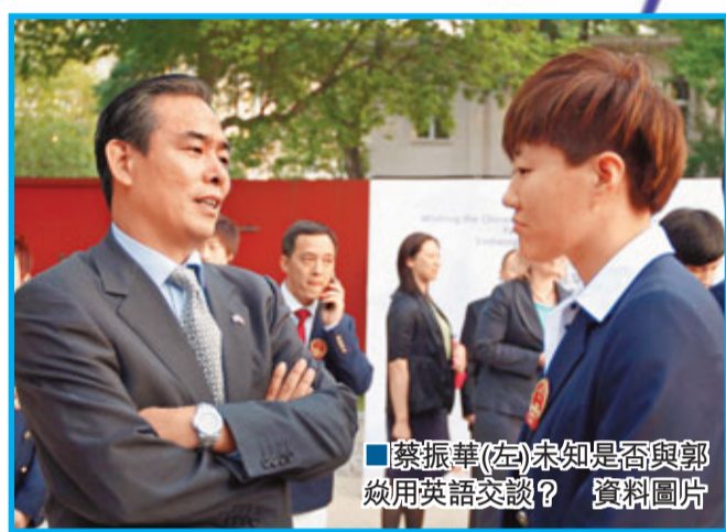
蔡振華(左)未知是否與郭焱用英語交談？資料圖片

香港文匯報訊（記者 梁啟剛）據《法制晚報》報道，中國乒乓球隊專職英語老師武迎潔等在自家的電腦前，沒過一會兒，世界冠軍王皓上線了，兩人通過視頻上英語課。目前，王皓和他的部分隊友正在深圳參加中國乒乓球公開賽，王皓也如常堅持學英語。事實上，不止王皓，現在國乒隊員們訓練、比賽之餘都在努力學英語，因為中國乒協已下令：2012年倫敦奧運會上，要獨自用英語面對世界媒體。