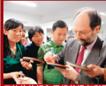
沙拉拉認為學好英語有利國乒。