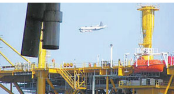
■日本海上自衛隊的P-3C反潛機飛臨中國春曉油氣田上空進行偵察。

香港文匯報訊 據《解放軍報》報道，15日上午，在中國東海，數十米高的春曉平台豎立在海面上。海監隊員告訴記者，春曉平台豎起來了，但沒有進行實質性開發。