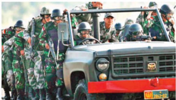
中印聯合訓練 6日，中國人民解放軍與印度尼西亞國民軍「利刃-2011」特種部隊，在印尼萬隆陸軍特種部隊訓練中心進行聯合訓練。這是中、印尼兩軍的首次聯合訓練。

船長告訴記者，海監船每次出海，只要接近東海中部海域，或是到了中國的春曉、平湖等油氣平台，外國飛機就會循聲動動，在海監船周圍久久盤旋不去，偵察和監視已成為家常便飯。