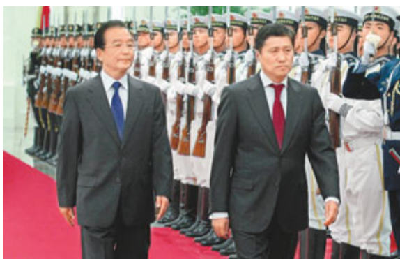
■中國總理溫家寶歡迎蒙古國總理巴特包勒德訪華。

新華社會見，就發展雙邊關係、中歐關係以及共同關心的國際和地區問題深入交換意見。在英期間，溫家寶總理將與卡梅倫首相舉行年度會晤。在德期間，溫家寶總理將與默克爾總理共同主持首輪中德政府磋商。