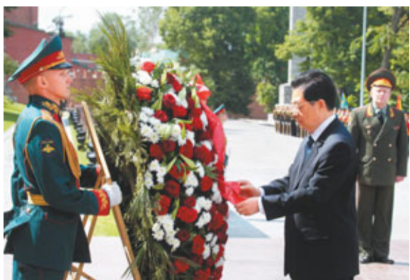
■胡錦濤在莫斯科向無名烈士墓獻花圈。

綜合新華社及中新社16日電 中國國家主席胡錦濤16日在莫斯科同俄羅斯總統梅德韋傑夫舉行會談，就推動中俄戰略協作夥伴關係持續健康穩定發展交換意見。同時，兩國元首發表了關於《中俄睦鄰友好合作條約》簽署10周年的聯合聲明，並見證了中國國家開發銀行與俄羅斯外經銀行關於人民幣業務的合作備忘錄、可再生能源和能源效率領域合作框架協議等7份合作文件的簽署。