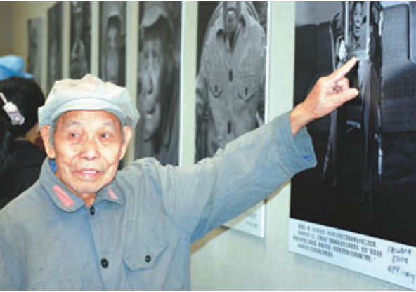
■年逾九旬的老紅軍回憶長征路上的故事。 資料圖片

其實，不只是袁純清看到了「紅色旅遊」給革命老區帶來的難得發展機遇，紅色旅遊近年來已經成為革命老區主抓產業。數據顯示，截至2010年底，中國紅色旅遊接待遊客超過14億人次，綜合收入突破7,000億元人民幣，年均增長均超過18%，直接就業人數超過90萬，間接就業人數超過370萬。