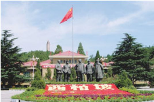
■西柏坡是紅色經典景區之一。