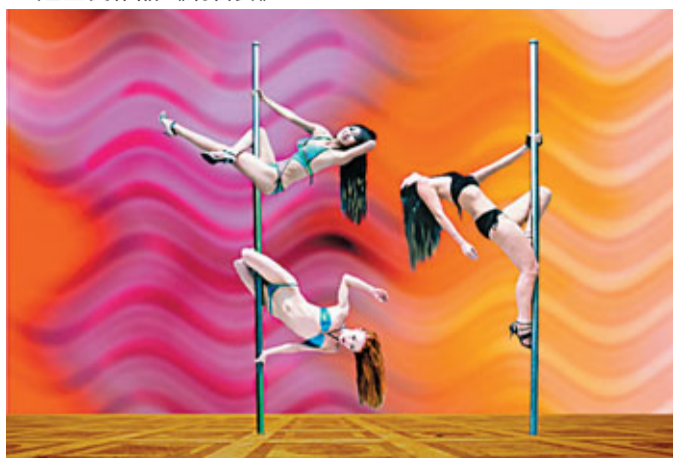
連登良作品《鋼管舞》