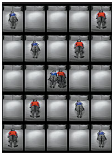
陳煥庭作品《人與人》