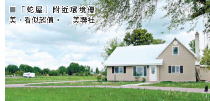
■「蛇屋」附近環境優美，看似超值。

美國房地產危機自2006年出現後仍未好轉，最近更步入雙底衰退，2006年至今房價累挫33%，較1920年代美國大蕭條期間的31%跌幅更嚴重。根據Case-Shiller數據，美國房地產價格首季下跌1.9%，分析指房價已出現雙底衰退，多倫多Capital Economics經濟學家戴爾斯更表示衰退尚未完結，今年會續跌3%，全年整體累跌5%。自次按危機爆發以來，美國銀行要求4/5樓按揭交20%首期；法拍屋持續增加令供應大增，令房價受壓。