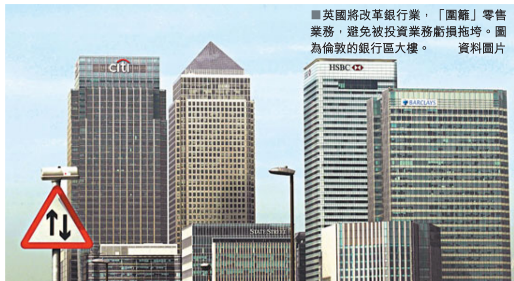
■英國將改革銀行業，「圍籬」零售業務，避免被投資業務虧損拖垮。圖為倫敦的銀行區大樓。資料圖片