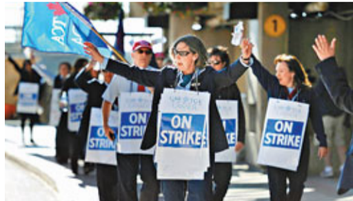
51%。國際機械師及航空工人協會數據顯示，自3月底以來，加航逾1萬名技工和行李搬運員、6,800名機組人員和3,000名機師仍未有落實新合約。