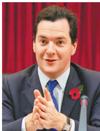
■英國財相歐思邦提出一系列銀行業改革方案。資料圖片

英國銀行業醞釀1930年代以來最大改革。英國財政部消息人士透露，財相歐思邦於當地周三晚(本港凌晨)在倫敦市長官邸的周年演說中，向商界表明支持英國銀行業獨立委員會(ICB)建議的「圍籬」(ring-fencing)零售業務，以免被俗稱「賭場銀行」的投資業務虧損拖垮，銀行最低一級資本充足率亦須提高至1成。消息拖累匯控、巴克萊和蘇格蘭皇家銀行股價在倫敦收市跌逾1%。