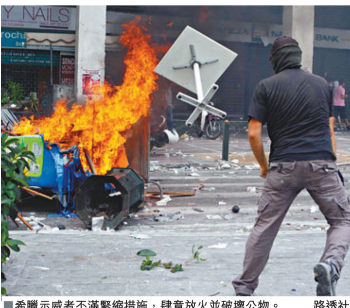
希臘示威者不滿緊縮措施，肆意放火並破壞公物。