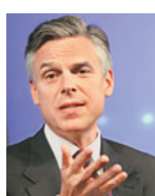
美國前駐華大使、前猶他州州長洪博培(見圖)昨日表示，他將於下周二正式宣布，參加2012年總統大選。一位接近洪博培的人士透露，正式宣布參選的儀式將於6月21日在紐約自由神像附近舉行。

51歲的共和黨人洪博培是少數令奧巴馬的競選團隊擔心的對手，雖然洪博培在美國國內的知名度不高。分析指，在共和黨可能產生的總統候選人中，洪博培與麻省前州長羅姆尼、明尼蘇達州前州長波倫蒂都屬於「第一梯隊」，只要能夠獲得黨內提名，這三人都有望對奧巴馬構成威脅。