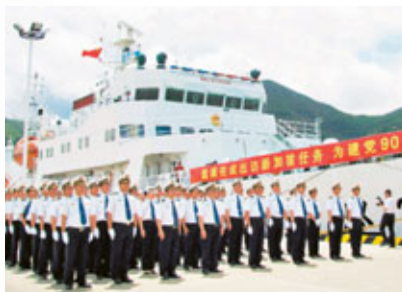
中國海事「海巡31」昨日整裝待發,準備啟航首訪新加坡。

航行的外籍船員進行重點的檢查。 「海巡31」是中國現代化和信息化程度最高的海事巡視船之一,也是中國海事系統第一艘適航無限航區國際航行入籍船舶,排水量有3,000噸,最大航速22節,在18節航速的時候,續航力6,000海里,自持力40天。