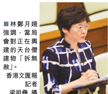
■林鄭月娥強調，當局會對正在興建的天台僭建物「拆無赦」。

就有報道稱有丁屋業主根據理順小組與當局就天台僭建物達成的「共識」，即部分僭建物面積未達天台總面積一半就可獲「豁免不拆」而趕搭「尾班車」加建僭建物，發展局發言人強調，根據目前的執法政策，所有正在施工或