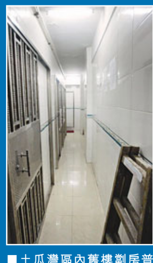
■土瓜灣區內舊樓劊房普遍。