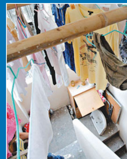
■唐樓後樓梯掛滿衣物、擺滿雜物，行走困難。