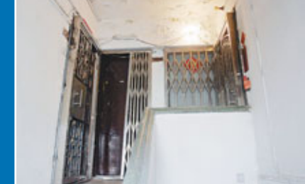
■有唐樓的天台整個被封上，改建成多個單位出租，居民根本逃生無門。