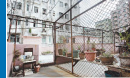
■個別天台被人用鐵絲網將大部分面積圍起，僅留下狹窄通道。

九龍樂善堂表示，經了解後，大部分受影響的災民會促逃生，故身無分文，部分人的家園付諸一炬，機構已即時啟動「樂善關懷基金」，向每戶災民發放5,000元，合共22.5萬元緊急經濟援助，有關款項將交由九龍城民政事務處向有需要災民發放，以及進行登記。