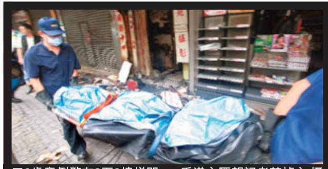
6歲童倒斃在2至3樓梯間。