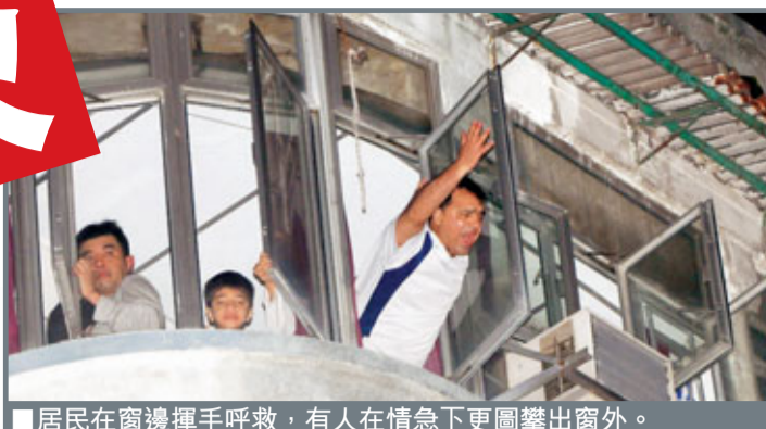
居民在窗邊揮手呼救，有人在情急下更圖攀出窗外。