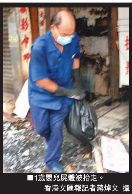
1歲嬰兒屍體被抬走。