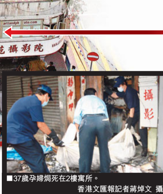
37歲孕婦焗死在2樓寓所。