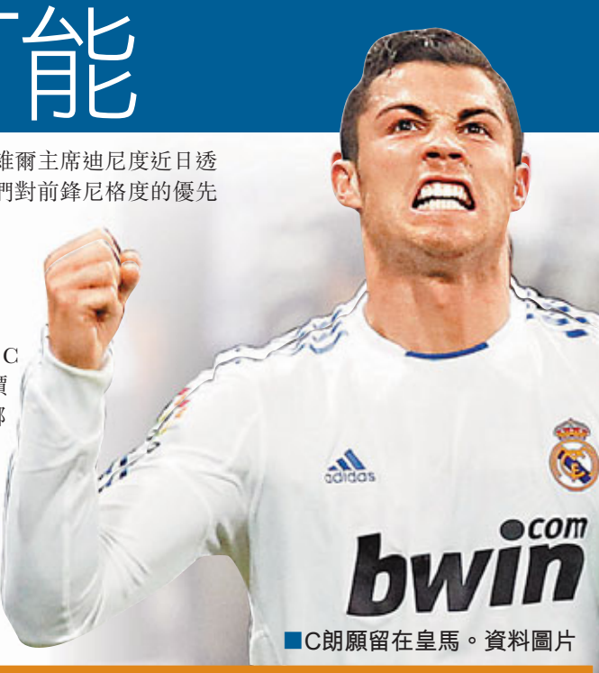
■C朗願留在皇馬。