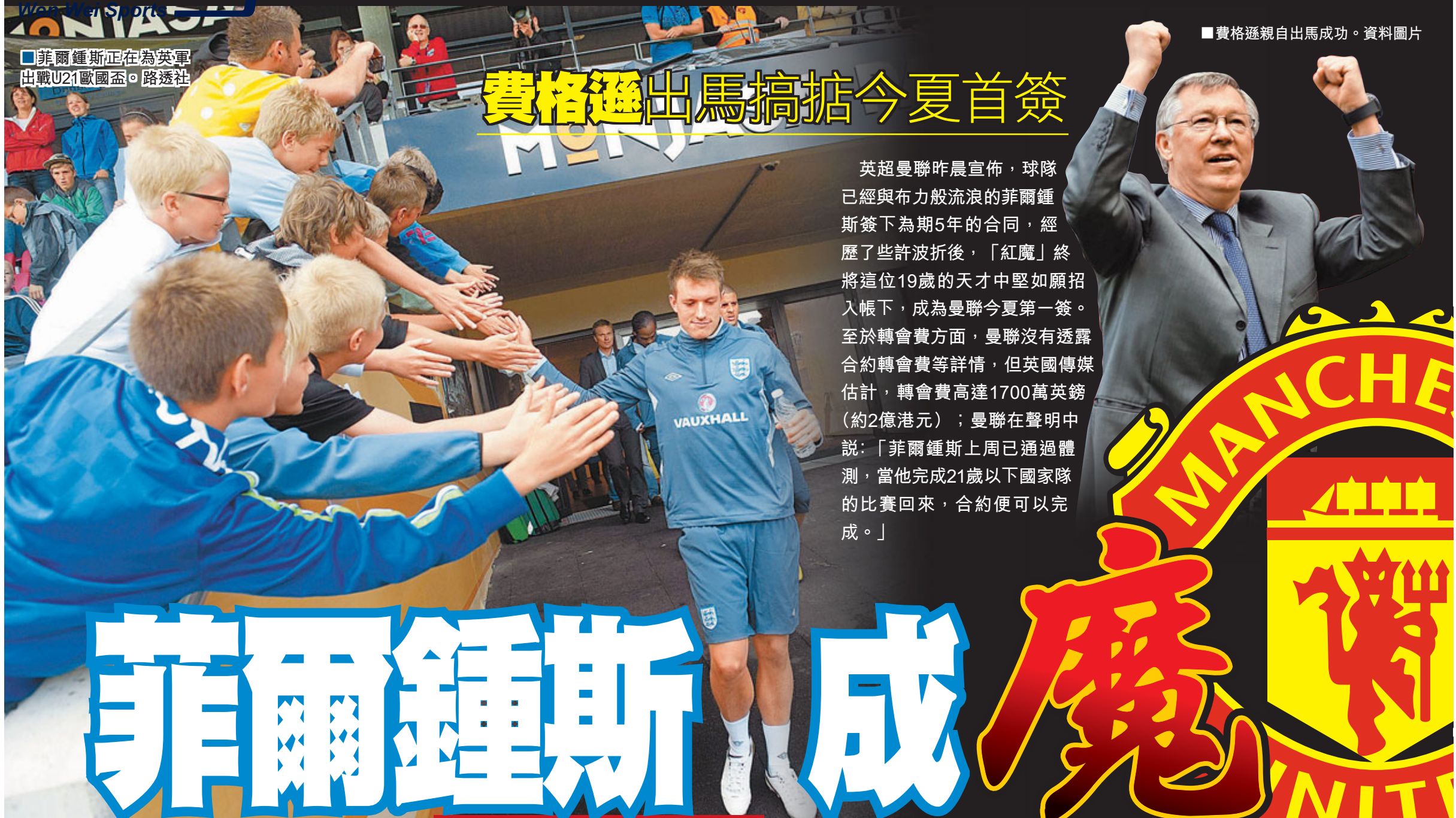
■費格遜親自出馬成功。資料圖片