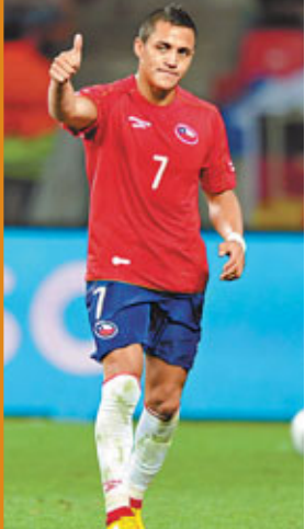
■阿歷斯山齊士號稱「智利C朗」。資料圖片

本周傳聞西甲皇家馬德里的C朗將以40萬歐元的天價周薪加盟英超球會曼城，後者願意為其出1.7億歐元的轉會費，並給他提供7號球衣和隊長臂章。在謠言傳得沸沸揚揚之時，當事人C朗出面進行了澄清：他表示自己不會與曼城簽約。