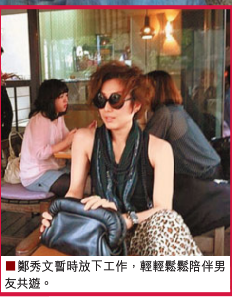
■鄭秀文暫時放下工作，輕鬆鬆鬆陪伴男共遊。