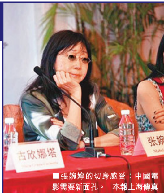
■張婉婷的切身感受：中國電影需要新面孔。 本報上海傳真

STAR」項目的新人共同參加今年在意大利舉行的羅馬電影節。若有還未簽約經紀公司的新晉演員，上海國際電影節將向國內、國際各經紀公司進行推薦，為其專業化發展提供幫助。中國評審張婉婷表示，中國電影在不斷發展，但是演員來來去去都是那些面孔，她看了很多參賽選手的DVD後，發現中國還有很多很有才華的新演員，「STAR HUNTER」是個很有意義的活動，希望能夠藉此找到更多出色的新面孔。至於新人的外形條件是否重要，幾位評委紛紛表示，外表不一定要漂亮，但是一定要有特點，魅力很重要，要有想法，有個性，而且EQ要高，需要學會承受事業上的起起落落。