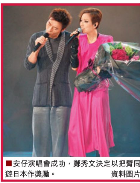
■安仔演唱會成功，鄭秀文決定以把臂同遊日本作獎勵。