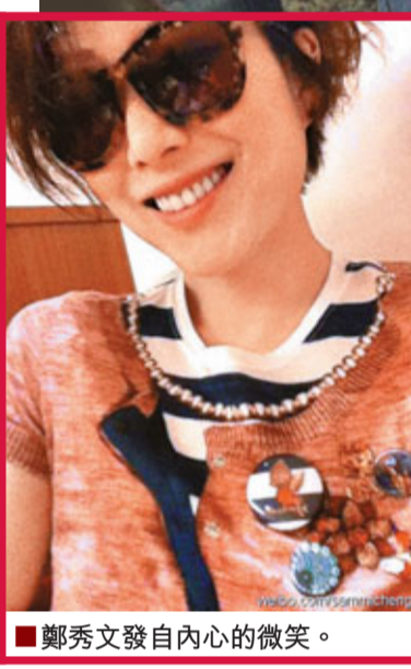
■鄭秀文發自內心的微笑。