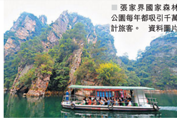
■張家界國家森林公園每年吸引千萬計旅客。 資料圖片

森林認證：一種運用市場機制來促進森林可持續經營，實現生態、社會和經濟目標的工具。森林認證通常包括森林經營的認證和林產品產銷監管鏈的認證。 資料來源：中國森林認證線上