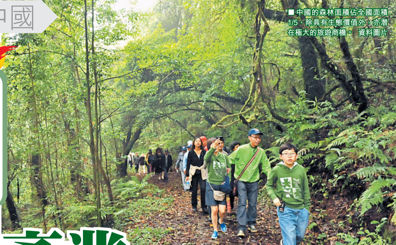
■中國的森林面積佔全國面積1/5，除具有生態價值外，亦潛在極大的旅遊商機。 資料圖片

香港浸會大學中國研究課程成立於1989年，至今已培養近兩千名本科生，為香港歷史最悠久的中國研究課程。香港文匯報與浸大中國研究課程合作推出通識專欄，以專業的角度，深入淺出地探究中國在社會民生、城市規劃、經濟轉型、外交政策等多方面的最新發展，為本港高中生提供具權威性的「現代中國」通識科單元學習材料。