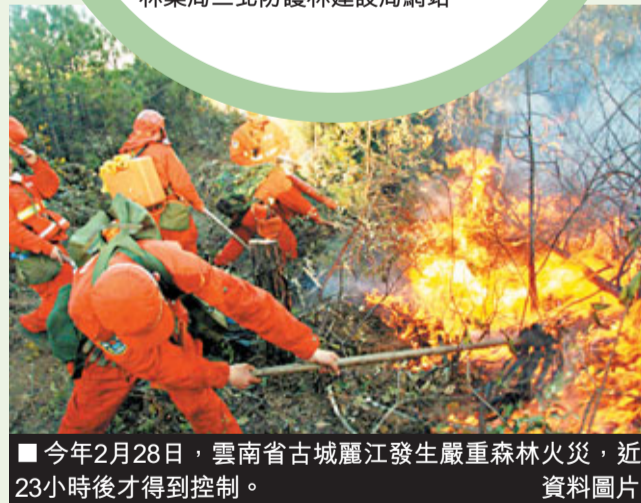
■今年2月28日，雲南省古城麗江發生嚴重森林火災，近23小時後才得到控制。 資料圖片

這是中國在「三北」地區(西北、華北和東北)建設的跨區域、多層次、具階段性和戰略性的人工森林工程，從1978年開始，至2050年結束，建設範圍東起黑龍江省，西至新疆維吾爾自治區，覆蓋中國北方13省(自治區或直轄市)，佔國土總面積約42.4%。兼具經濟、環境和社會效益的三北防護林曾被鄧小平稱為「綠色長城」。資料來源：國家林業局三北防護林建設局網站