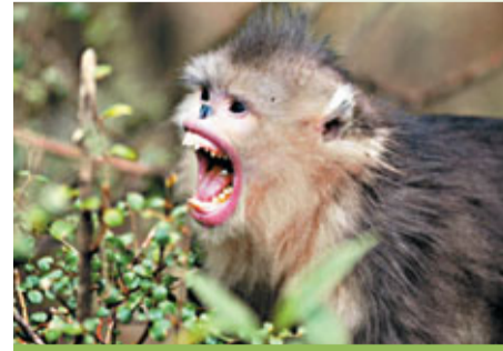
▼由於濫伐森林，滇金絲猴幾近瀕臨絕種。