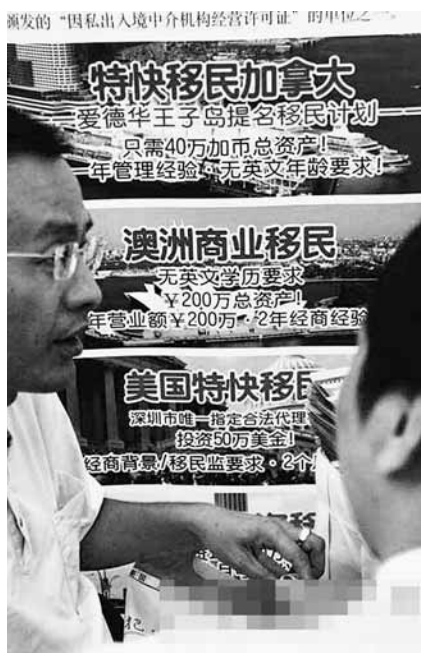
■ 目前內地投資移民的主要人群年齡集中在35至45歲，基本上是舉家移民。資料圖片

香港文匯報訊 據《新京報》14日報道，近幾年，通過投資方式移居海外的中國人日趨增多。有調查顯示，內地可投資資產規模在1億元以上的高淨值人群中，約27%的人已經完成投資移民，而正在考慮投資移民的比例高達47%。專家擔憂：富人移民不僅帶走數以萬億計的資本，更是精英的流失，內地正面臨着「人財兩空」的風險。