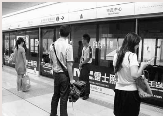
■ 深鐵4號線延長線16日正式開通。

香港文匯報訊（記者 郭若溪 深圳報道）總長156公里，設車站111座，總投資約750億元的深圳軌道交通二期工程5條地鐵新線路15日起至本月28日將陸續開通，深圳即將迎來地鐵網絡化運營時代。