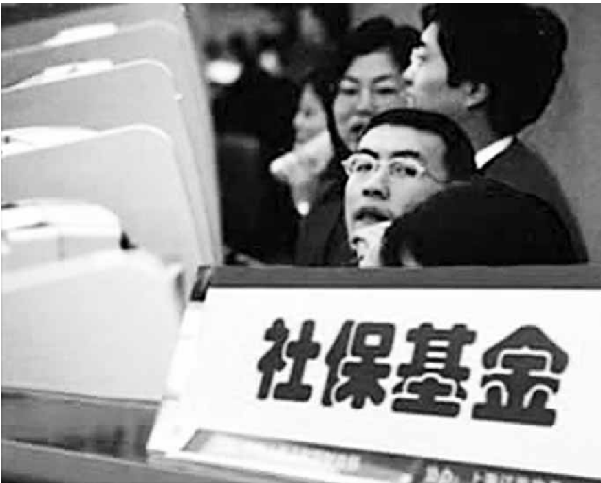
■ 社保基金結餘已從2000年的1224億元猛增至1.41萬億元。如此龐大的資金是老百姓的養命錢、救命錢，投向何處卻是個謎。

課題組連續三年的調查中，各省主動公開的信息都極少，大部分是應申請而公開的。最新的調查顯示，31個省（區、市）中河北表現最好，完全公開了22項信息，部分公開了3項信息。有18省提供了部分信息。另有12省未提供任何信息。有一個省的社保年報竟然全部是參保人數的統計，沒有一個關於社保基金金額的數據。