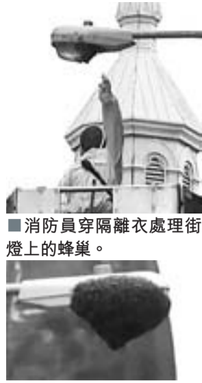
消防員穿隔離衣處理街燈上的蜂巢。