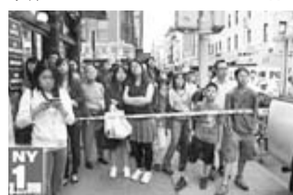
紐約唐人街民眾圍觀