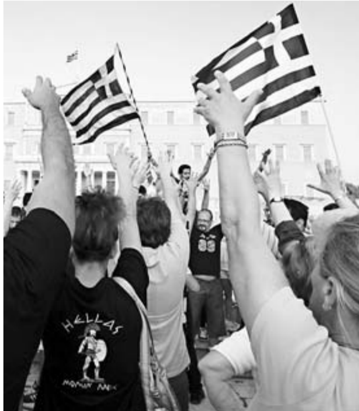
希臘示威民眾揮舞國旗圍國會，抗議緊縮政策。