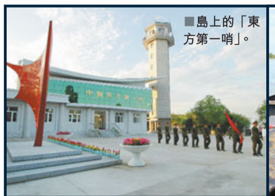
島上的「東方第一哨」。

相關人士預測，黑瞎子島的夏季養生度假、避暑休閒旅遊格外引人矚目，必將很快成為著名旅遊勝地。