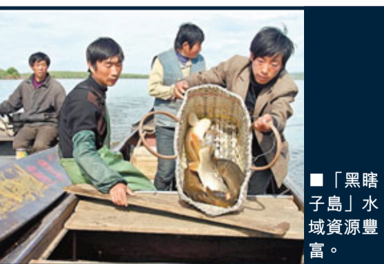
「黑瞎子島」水域資源豐富。