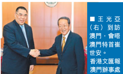
■王光亞（右）到訪澳門，會晤澳門特首崔世安。

香港文匯報訊（記者 林婉琪 澳門報導）王光亞在結束香港的工作考察後，即轉赴澳門考察3日。抵埠後，王光亞會見了全國政協副主席何厚鏞，隨後與澳門特區行政長官崔世安及澳府各主要官員會晤，並先後往新葡京及銀河娛樂等參觀。