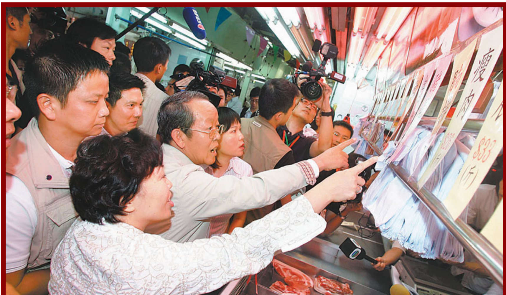
■在天恩邨街市，王光亞（前排中）仔細了解肉類及蔬果的售價。

香港文匯報訊（記者 鄭治祖）香港特區政府近期施政屢遇阻撓。王光亞在離港前的記者會上回應提問時坦言，香港社會圍繞一些問題有不同聲音，「我的感覺是，任何一項大的政策出台，都會在社會上出現不同的看法，社會不同的群體對大政策有不同看法是正常的」，而作為特首會有他的判斷，「如果這項政策、這項措施，從長遠、從整體、從根本上來說，符合香港的利益，就應該堅持」。