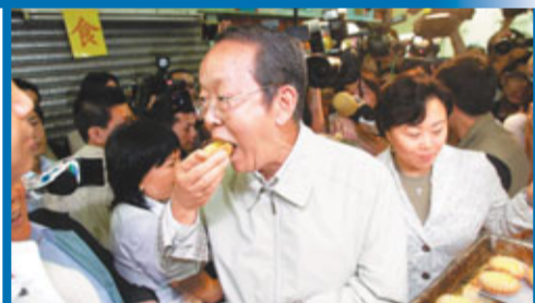
■王光亞到訪街市，餅店老闆主動向王光亞送上蛋撻。

隨後昨天生日的大龍華燒味檔主蕭先生，感謝王光亞為自己帶來「永世難忘」的記憶，「我沒有想過王光亞願意到訪低階層的街市，還關心大家生意情況，態度更是難得的親民」。「和田麵包西餅」店主則稱，鄭汝樺於上星期六曾到街市視察場地，並購買了老婆餅及合桃酥。