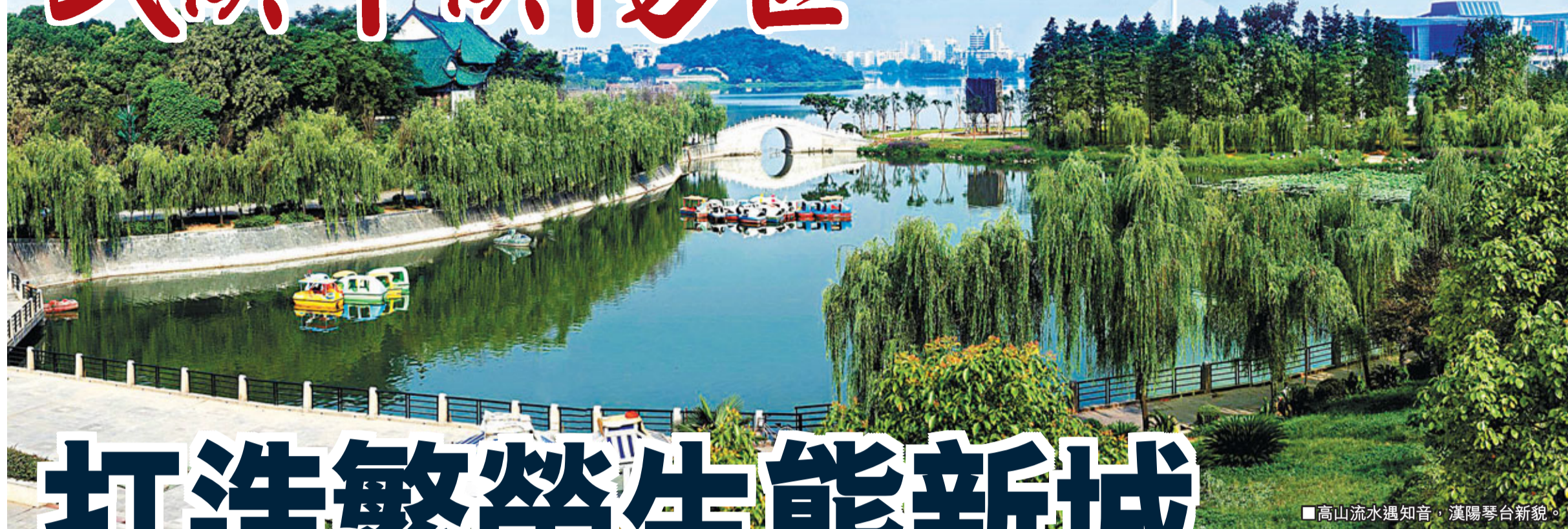
■高山流水遇知音，漢陽琴台新貌。

獨特的地理區位、深厚的歷史底蘊、豐富的山水資源、鮮明的產業特色、便捷的水陸交通，使得獨居三鎮一方的漢陽在中部龍頭城市武漢的迅速崛起中獨具後發優勢。