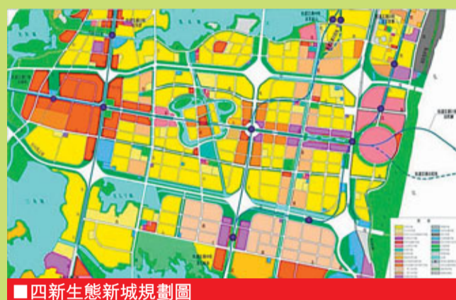
■四新生態新城規劃圖