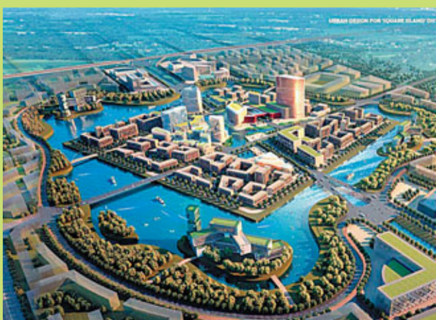
■四新方島項目效果圖

「晴川歷歷漢陽樹，芳草萋萋鸚鵡洲。」漢陽區是武漢知音文化的發祥地，近代工業文化的發源地，歷史悠久、人文薈萃。區內長江和漢江兩江岸線長達32公里，水域面積佔比30%，生態環境優美，世茂、華潤等房企均早選擇漢陽區開發高尚居住區。武漢正在加緊建設的城市軌道交通中，有55.7公里位於漢陽區，總面積108平方公里國土面積中，待開發面積近50平方公里，空間腹地廣闊，其中，四新地區可開發用地3萬餘畝，永豐地區4萬餘畝。