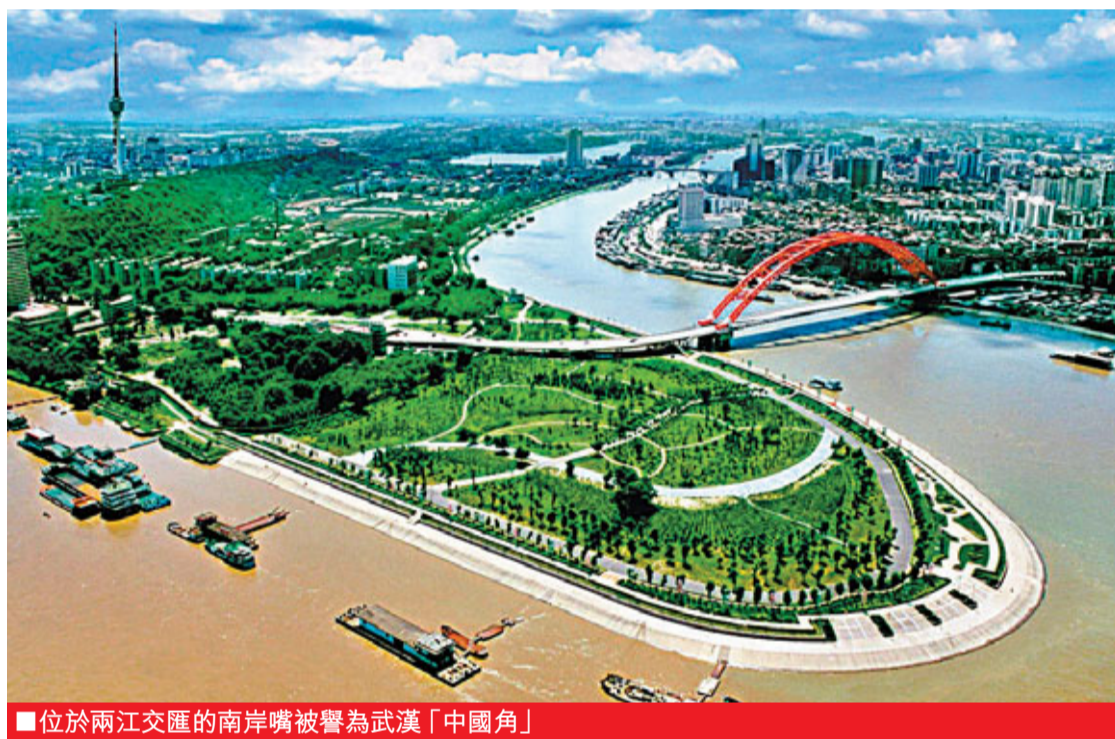
■位於兩江交匯的南岸嘴被譽為武漢「中國角」

發高尚居住區。武漢正在加緊建設的城市軌道交通中，有55.7公里位於漢陽區，總面積108平方公里國土面積中，待開發面積近50平方公里，空間腹地廣闊，其中，四新地區可開發用地3萬餘畝，永豐地區4萬餘畝。