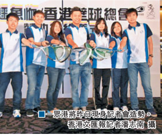
一眾港將昨日現身記者會造勢。