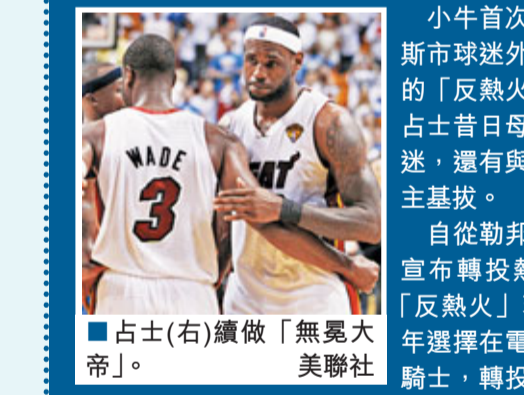
占士(右)續做「無冕大帝」。

小牛首次贏得總冠軍，除了達拉斯球迷外，最高興的還有以億計的「反熱火」球迷，當中包括勒邦占士昔日母會的騎士球迷和公牛球迷，還有與占士徹底決裂的騎士班主基拔。自從勒邦占士與保殊在去年夏天宣布轉投熱火後，今季一直存在「反熱火」現象。「大帝」占士去年選擇在電視直播中高調宣布離開騎士，轉投另一支東岸球隊熱火，此舉傷盡克里夫蘭市所有騎士球迷和班主基拔的心，後者更向騎士球迷許下承諾，一定會快占士一步贏得總冠軍，而占士和韋迪去年一直對加盟公牛搖擺不定，同樣激怒了公牛球迷，自此熱火成為球迷公敵。