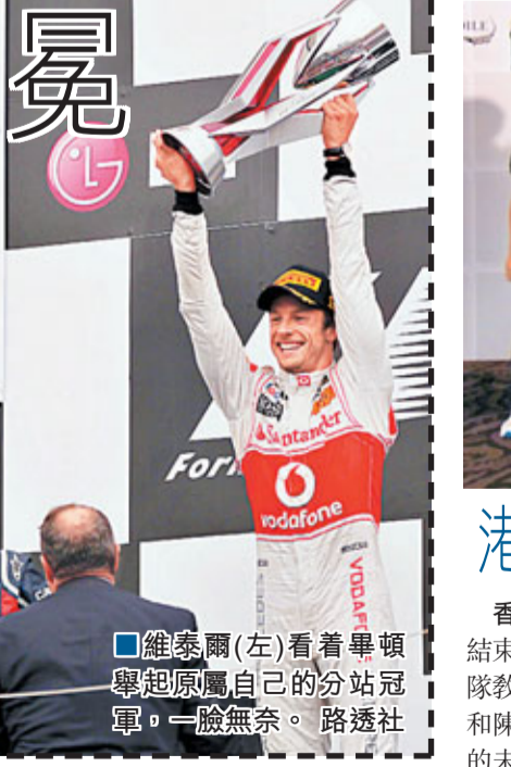
維泰爾(左)看着畢頓舉起原屬自己的分站冠軍。一臉無奈。

畢頓賽後說：「即使我今天沒有奪冠，我也會非常享受比賽的過程。」這位麥拿倫車手在第4排出發，開局不利，在遭遇2次小碰撞及一次超速判罰後，排名一度降到第21位。第25圈時，雨水淹沒賽道，賽會唯有揮動紅旗暫停比賽，而畢頓此時已經升至第10位。延遲2小時4分鐘後復賽，畢頓在最後一圈把握維泰爾在最後一個彎道出現失誤，趁機超越，上演超級大逆轉。維泰爾賽後失望說：「我每一圈都在領跑，除了最後一圈，具體說應該是除了最後半圈。那彎道的失誤可能是我整場比賽唯一的失誤。」維泰爾的紅牛隊友韋伯獲得第3名，而一度位列次席的平治車手舒麥加則以第4名完成，這是7屆世界冠軍自去年復出後的最佳成績，但仍未能再次站上頒獎台。