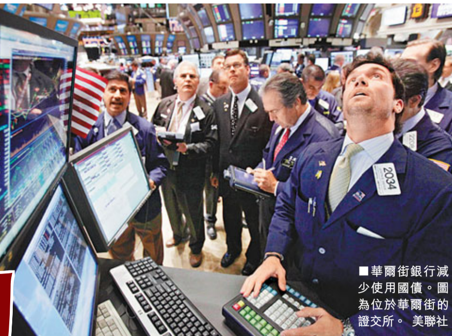
華爾街銀行減少使用國債。圖為位於華爾街的證交所。

美國民主、共和兩黨仍就提高美國債務上限爭論不休，據美國資深銀行高管透露，若不盡快提高上限，市場很可能出現波動，華爾街最大的一些銀行正部署應變方案，準備在8月份削減對美國國債的使用，以消滅市場波動帶來的衝擊。