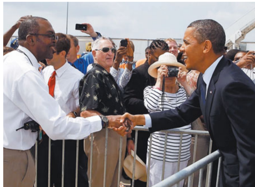
美國總統選舉拉開序幕，奧巴馬在北卡羅來納州爭取選民支持。