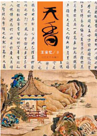
《天香》簡體字版由人民文學出版社出版。