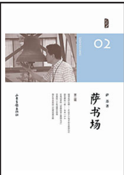
作者：薩蘇 出版社：山東畫報出版社 定價：人民幣24元

2003年，薩蘇在日本從一本上個世紀60年代的舊雜誌上，讀到了定遠艦的故事。直至2009年，他驚訝地發現，定遠館這座幾乎被人遺忘的建築，依然安然留存於日本福岡，「變身」為一間玩具倉庫。以