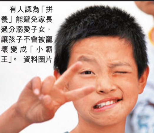
有人認為「拼養」能避免家長過分溺愛子女，讓孩子不會被寵壞變成「小霸王」。 資料圖片