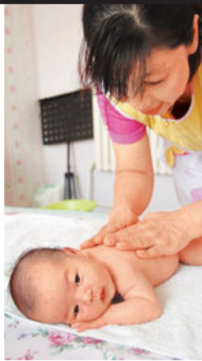
有機構估計，內地一個孩子從出生至大學畢業需要約50萬元養育費。 資料圖片