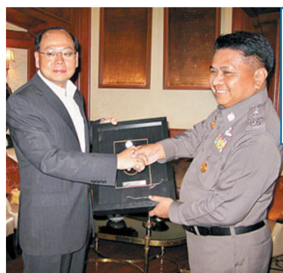
特區警務處處長曾偉雄昨日訪問泰國期間，拜訪泰國皇家警察總長 Wichan Potechosree，並與當地高層警務人員會晤，商討共同關注的警務事宜。雙方達成共識，全面加強兩地警務合作。香港警務處與泰國皇家警察將訂定諒解備忘錄，落實加強訓練合作及打擊販毒、清洗黑錢及科技罪案等跨境罪行。

至於有關新界村屋僭建問題，林鄭月娥指，當局正與鄉議局商討，相信短期內可推出合法、合情、合理的理順方案。而市區僭建物方面，她表示，當局短期內，會展開大型巡查行動，天台、平台以至後巷等的僭建物，即使無即時危險，業主都會被要求拆除，但當局會提供足夠時間供拆除。 本月20及28日交代處理方法 不過，亦有部分小型僭建物可以豁免，例如：冷氣機、晾衫架、簷篷等小型裝置，只要有專業人士確定其結構安全，則毋需拆除。此外，當局會修例，把廣告招牌納入小型工程監管制度，要求市民進行檢查，證實安全後，才可獲豁免清拆。她表示，當局會在本月20日及28日，交代市區及新界僭建物的處理方法。