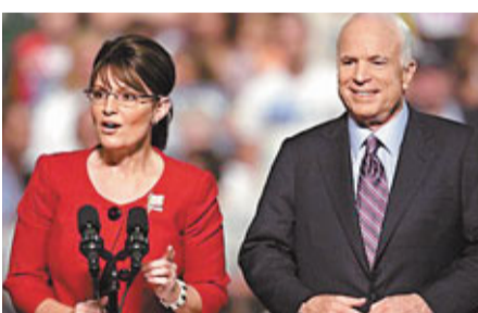
08年總統大選時，佩林(左)成功爭取當上麥凱恩副手。

邀議能源政策 引麥凱恩注意 電郵證實佩林花費3.5萬美元(約27萬港元)購買太陽床放在官邸，並千方百計對外隱瞞。佩林的常識經常成為傳媒笑柄，記者追問她「是否認為人類與恐龍活在同一時期」，令她大為苦惱。成為副總統候選人後，她不時收到恐嚇電郵，有封信寫着「一定要殺死佩林」，另有來自比利時的電郵聲稱要槍殺她「伸張正義」。 2008年大選前，佩林只是名默默無聞的州長，麥凱恩的決定令外界大跌眼鏡。但電郵顯示，佩林其實早於同年6月，已經多次與幕僚研究如何擴大其影響力，