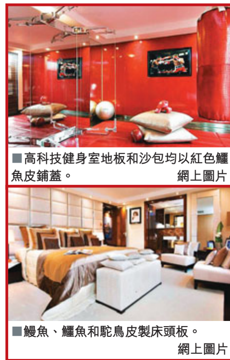
■高科技健身室地板和沙包均以紅色鱷魚皮鋪蓋。