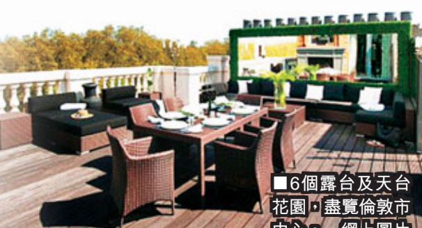
■6個露台及天台花園，盡覽倫敦市中心。 網上圖片

花錢最多的超級富豪來自東歐、俄羅斯及前蘇聯聯盟國家，平均消費620萬英鎊(約7,832萬港元)；緊隨其後是中東，平均消費400萬英鎊(約5,053萬港元)。中國買家每年在當地花200萬英鎊(約2,526萬港元)買樓，地產商預計中國超級富豪將成為生力軍，繼續推高樓價。 ■《每日郵報》/路透社/彭博通訊社