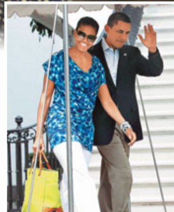
■奧巴馬一邊憂心經濟差會拖累其選情，一邊與夫人米歇爾離開白宮度週末。

除美國自身問題外，最困擾大市的無疑是歐債危機。研究機構Capital Economics首席美國經濟師阿什沃思說，歐洲和新興市場經濟增長均有放緩跡象，將令美國出口受壓。 ■《紐約時報》/《華盛頓郵報》/《華爾街日報》/路透社/法新社