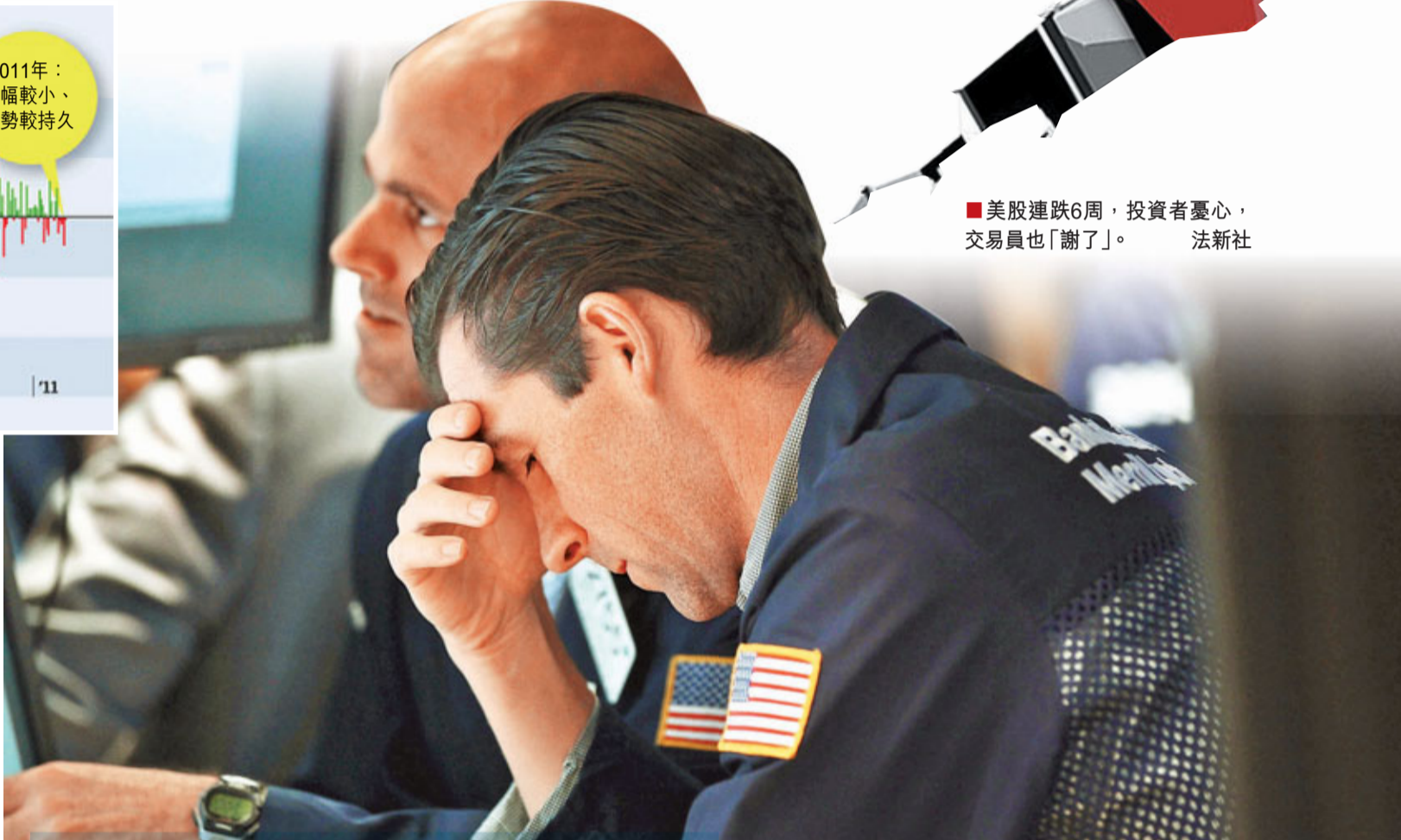
■美股連跌6周，投資者憂心，交易員也「謝了」。

在股市下跌同時，個別商品價格亦告回落，銅價上周下跌1.1%，顯示投資者預期全球需求減少。另外，受沙特阿拉伯可能增產至每日1,000萬桶消息影響，油價上周五急跌2.6%，收市跌穿100美元。 ■英國《金融時報》/《華盛頓郵報》