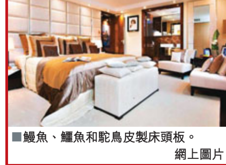
■鱷魚、鱷魚和駝鳥皮製床頭板。