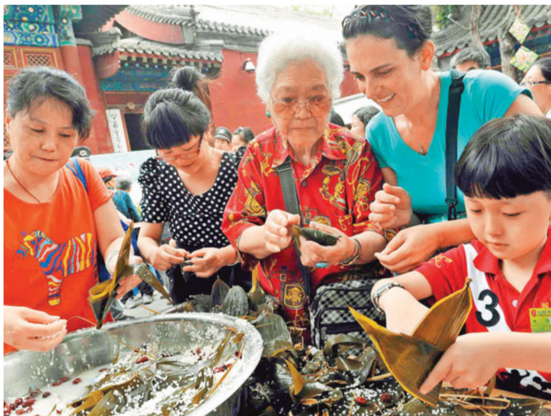
■端午節, 北京舉行包粽子活動吸引海內外遊客參與。

另據測算, 2010年, 中國城鄉居民家庭文化娛樂類的休閒消費支出為3,485億元; 城鄉居民全年休閒體育消費總額約為2,543億元, 較上年度增加22.1%; 中國休閒餐飲消費大致為4,400億元, 較上年增長18.9%; 2010年中國沐浴業收入預計達到12%左右的增幅, 全國沐浴企業收入將達到1,400億元。此外, 宋瑞表示, 全民健身掀起了新的高潮, 社區體育、農村體育受到重視, 體育旅遊(非職業比賽、探險、場館觀光等)成為一個亮點。