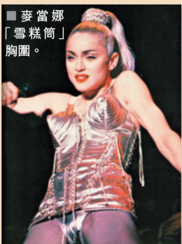
麥當娜「雪糕筒」胸圍。

又要靚，但又沒有閒錢的，只能轉投質劣廉價的「水袋裝置胸圍」市場。而當時，歐美財經投資者正四出尋找資金避難所。一直被看低一線、被評為落後的巴西、俄羅斯、印度、中國及南非等發展中國家便乘勢冒起。近年，隨着經濟逐漸復甦，經濟學家和投資者開始留意各國市場動向，準備趁低吸納，比人先行一步，希望來一個大翻身，所以一些發展中國家的胸圍尺碼也就成為重點觀察及分析對象。