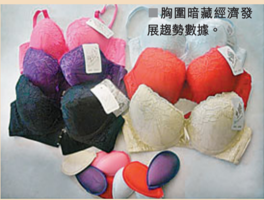
胸圍暗藏經濟發展趨勢數據。

70年代，經濟發展名列前茅的幾個大國，也就是「出產」平均胸部最大尺寸女性的國家。社會學家統計表