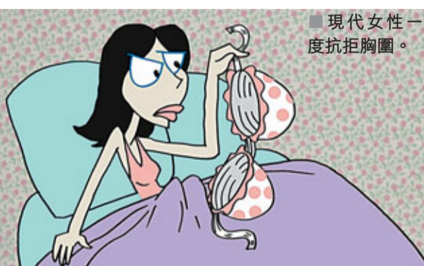
現代女性一度抗拒胸圍。

「美女經濟學」又或「大胸經濟學」指出，一般人指「胸大的女人都沒頭沒腦」，這卻是大錯特錯！美國研究發現，女人胸部愈豐滿，智商反而愈高。美國社會學家艾溫·羅斯戴爾把1,200名女性根據胸圍大小分為5種等級，測試她們的智商和分析能力。結果發現，身段豐滿的女性