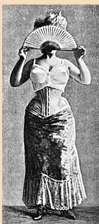
古代的胸圍設計簡單。

胸圍，陪伴女性經歷百年滄桑。中國人幸運一點，古時還沒有胸圍，用的是肚兜內衣。胸圍在西方世界誕生初期，是以帆布、鯨魚骨、鋼線和哩士製造。這些東西，長期穿着不但肌肉會勞損變形，而且內臟也會受到損害。直至1889年，法國巴黎內衣製造商Hermine Cadolle才發明出世上第一個「正常」的胸圍，束縛胸部而無須同時束縛橫膈膜。這名設計師是一名女性。1935年，有公司發明乳杯，由A至D級排列大小。最近，英國著名內衣品牌Gossard便推出「超滑胸圍」(Super Smooth Bra)，採用無縫、無針孔、無彈性及無標籤設計，讓使用者感到非常舒適，又不會在衣服上露出蛛絲馬跡。似乎，胸圍的設計愈來愈貼心、愈來愈先進，逐漸和女性的身體合二為一。