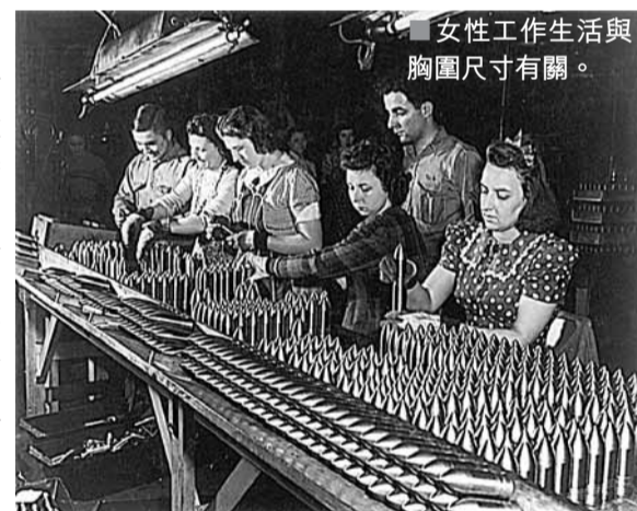
女性工作生活與胸圍尺寸有關。

胸圍是女性內衣，原始功能是用以遮蔽及支撐乳房。一直以來，女性最大敵人除了是肥胖外，便是地心吸力。胸圍的發明，自然是對大自然力量的消極抵抗。20世紀初，人類科技高速發展。及至世紀中期除了核科技外，人類還成功衝出大氣層，親足踏上月球表面。雖然，登月的太空人並非女性，但人類處於無重力狀態，脫離地心吸力的束縛。升空，卻為女性帶來無窮「升胸」願景。雖然，太空人還未能移居外太空，只能作短暫漫步，可是研究員發現，當時竟然有設計師以登月為主題，設計出科幻錐形胸圍，標榜反地心吸力，結果產品大受歡迎。而50年代性感女神瑪麗蓮夢露穿的尖挺胸圍，以及90年代麥當娜的「雪糕筒」胸圍，更象徵女性「升胸」的願望。