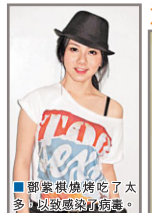
鄧紫棋燒烤吃了太多，以致感染了病毒。