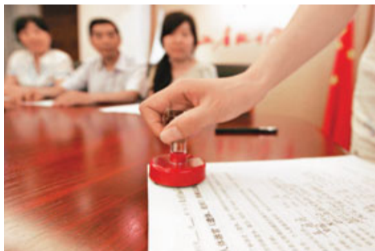
■中央政府透過各種方法鼓勵人民捐贈器官。圖為杭州市一家三口簽署人體器官捐獻志願書。

雖然捐贈者作出無私的奉獻，但因器官移植手術涉及健康評估、器官保存和運輸等環節，醫院需對病人收取高昂費用。這令部分不了解的捐贈者誤以為醫院藉此賺大錢，感到其原意與結果不符，引起反感。