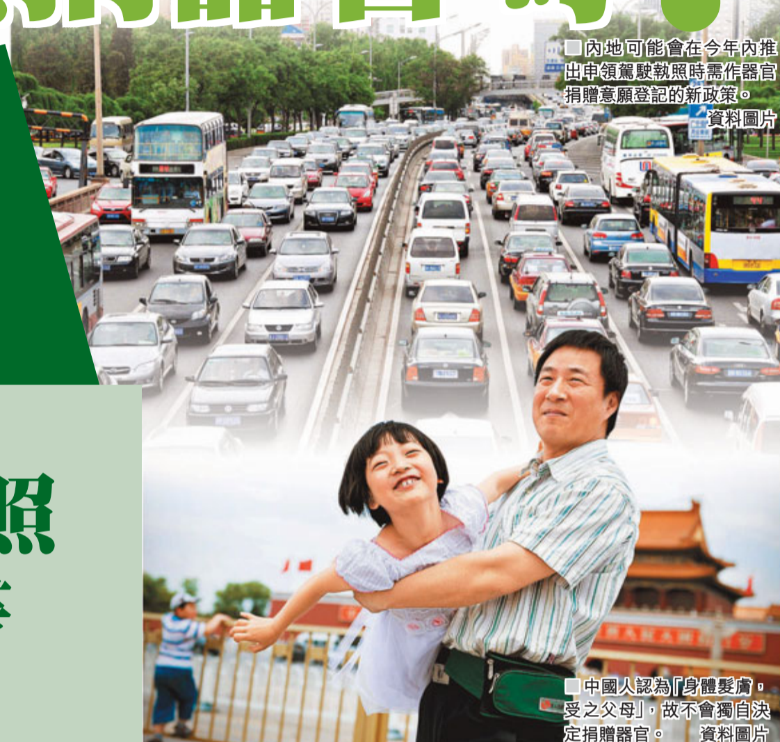
■內地可能會在今年內推出申領駕駛執照時需作器官捐贈意願登記的新政策。 資料圖片