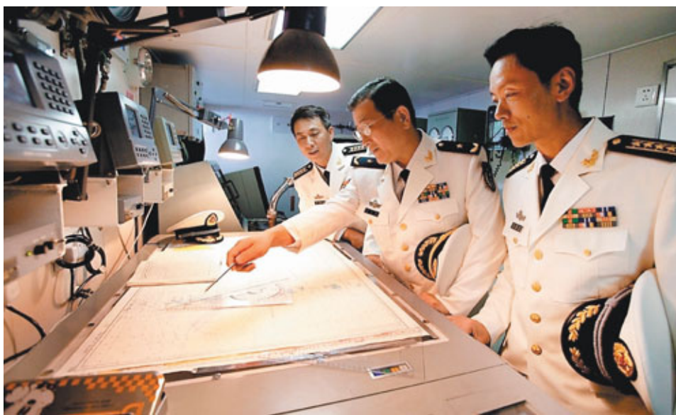
■海軍某部遠航訓練中，指揮員制定航海路線。