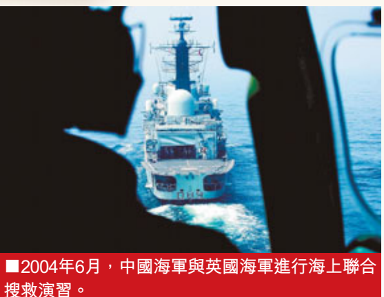
■2004年6月，中國海軍與英國海軍進行海上聯合搜救演習。

隨著作戰理念的更新和武器裝備的升級，國產第三代戰艦上首次出現了「方面長」這一新崗位。對空長、對海長可以根據艦長的指令，全權組織對空或對海所有導彈、火炮、電子戰等武器的使用，從而使艦長有更多精力關注整個戰場。聯合、聯訓、聯戰……新一代水面艦艇部隊