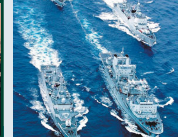
■中國海軍海上艦艇編隊演練。