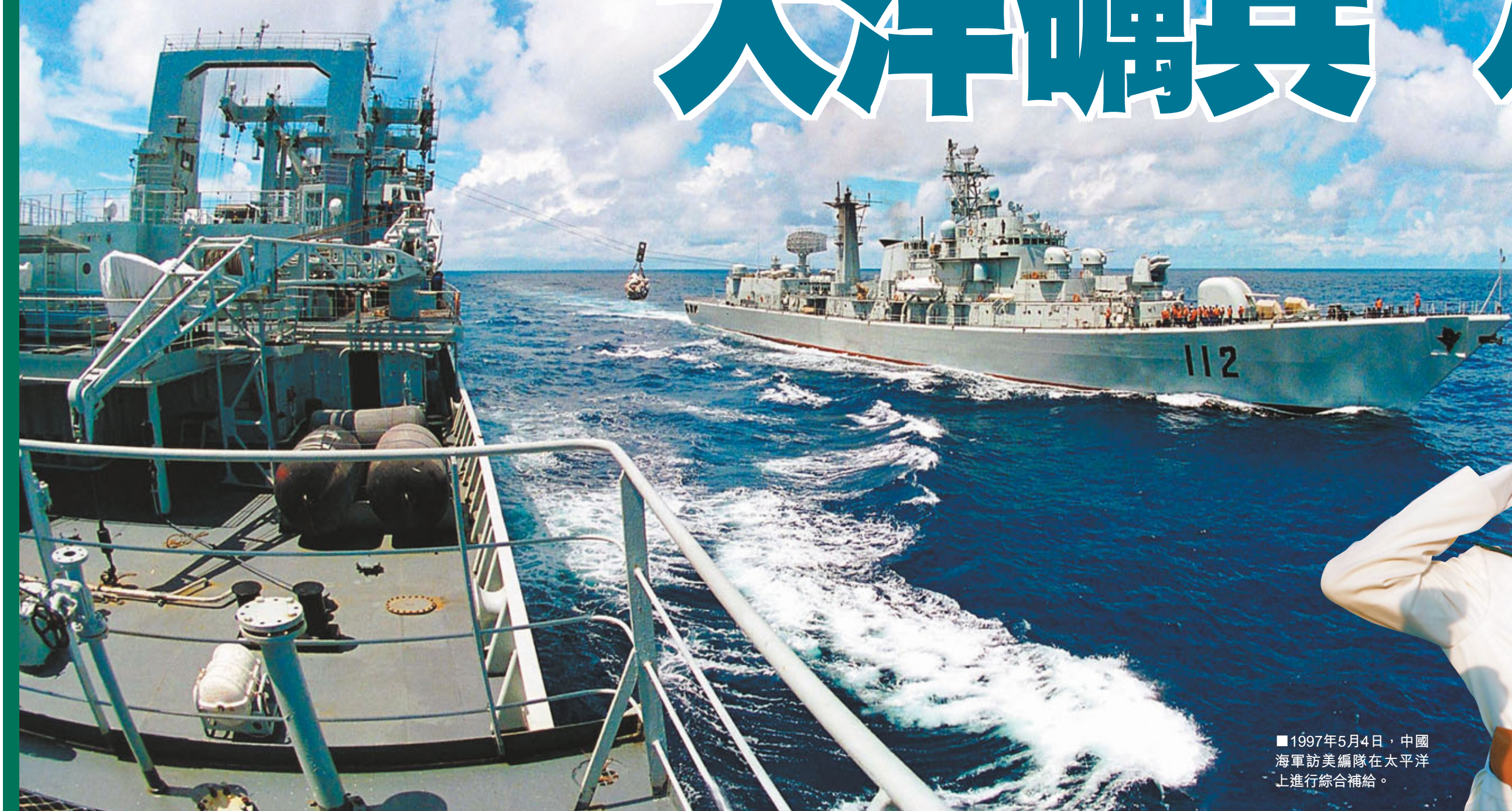
■1997年5月4日，中國海軍訪美編隊在太平洋上進行綜合補給。

國家興旺看海軍，海軍發展看軍艦。一艘艘威武的軍艦、一支支遠航的編隊背後，是中國的日益強大和國際地位的不斷提高。驚濤駭浪中成長起來的中國海軍水面艦艇部隊告訴世人：日益成長壯大的中國海軍，有能力維護國家利益、維護世界和平。