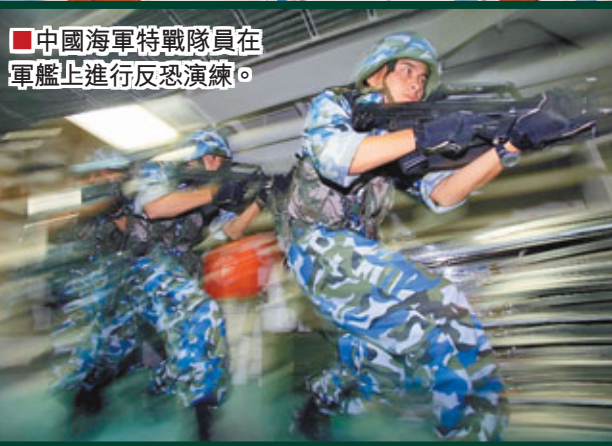
■中國海軍特戰隊員在軍艦上進行反恐演練。