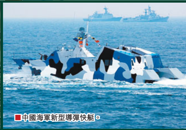
■中國海軍新型導彈快艇。