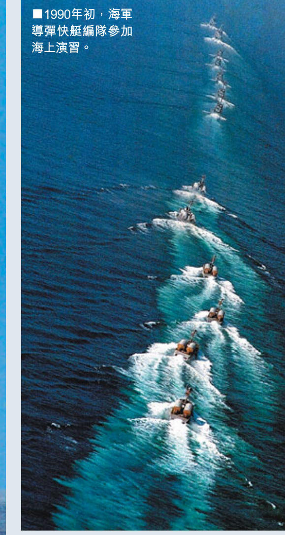
■1990年初，海軍導彈快艇編隊參加海上演習。