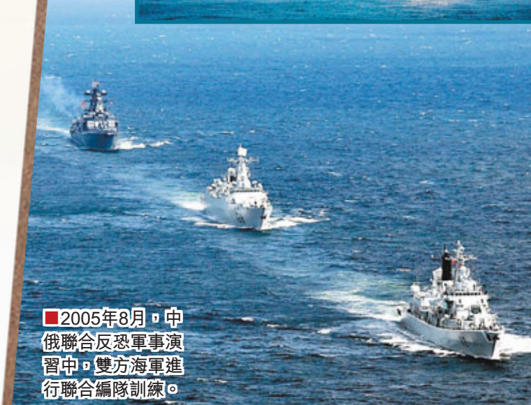
■2005年8月，中俄聯合反恐軍事演習中，雙方海軍進行聯合編隊訓練。

訓練大綱中一個個高頻「關鍵詞」背後，向外界傳遞著這樣的信息：中國海軍諸軍兵種近海綜合作戰能力已基本形成，遠海機動作戰能力正穩步發展。