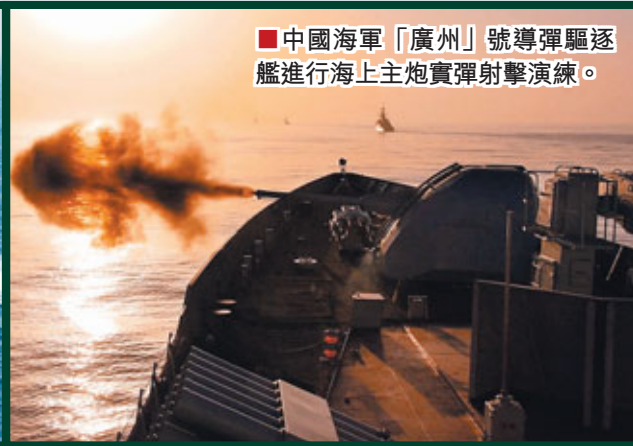
■中國海軍「廣州」號導彈驅逐艦進行海上主炮實彈射擊演練。