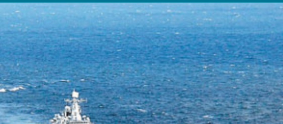
■2005年8月，中俄聯合反恐軍事演習中，雙方海軍進行聯合編隊訓練。