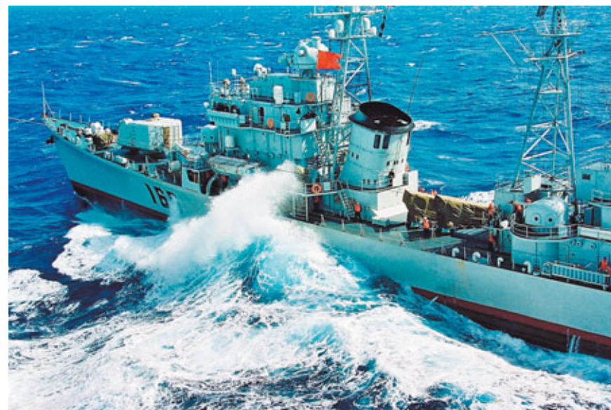
■中國軍艦戰風鬥浪闖大洋。