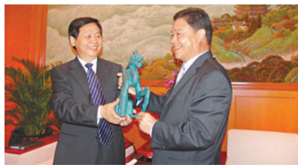
王憲魁(左)向外交部駐港特派員公署特派員呂新華致送「坐龍」禮品。

香港黑龍江經濟合作促進會會長劉宗明亦指出，今年是「十二五」開局之年，黑龍江省再次到本港招商，說明當地政商界對香港十分重視，對港企亦相當信賴。而港資企業在黑龍江省日益增多，亦說明對該省的投资環境有信心。他呼籲更多港企到當地「走一走，看一看」，為兩地合作共創雙贏。