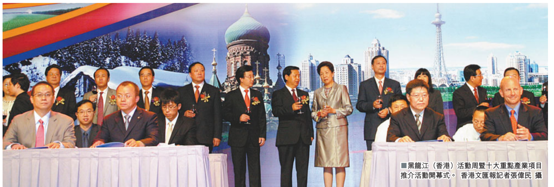
黑龍江(香港)活動周暨十大重點產業項目推介活動開幕式。