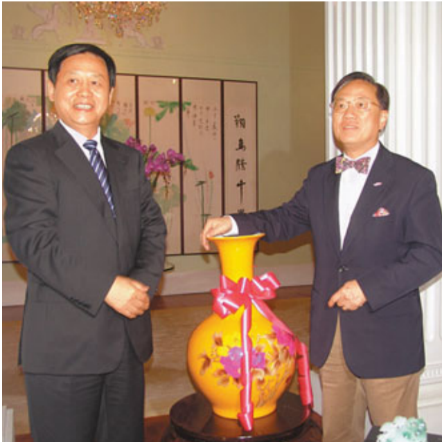
黑龍江省省長王憲魁昨日上午專程前往禮賓府，拜會特區行政長官曾蔭權。

香港文匯報訊(記者 楊同玉)正在香港出席「2011黑龍江(香港)活動周」的黑龍江省省長王憲魁，昨日上午專程前往禮賓府，拜會行政長官曾蔭權。曾蔭權與王憲魁會談時，談到曾到訪黑龍江省的伊春市。伊春是中國森林覆蓋率最高的城市，被譽為「中國林都」。伊春市市長王愛文介紹說，曾特首訪伊春時還獻了一份愛心，在伊春認領了一棵紅松，並把一幅有曾蔭權認領紅松的照片作為禮物送給他，並告訴曾蔭權特首，他認領的紅松在當地也成為了一景，很多到那裡的人都要留影為念。