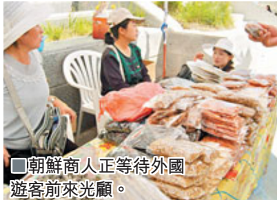
朝鮮商人正等待外國遊客前來光顧。

香港文匯報訊 (記者 廖一、崔月、劉靖宇報道) 據新華社引述中國商務部9日發佈消息稱，本月7日至9日，中朝羅先經濟貿易區和黃金坪、威化島經濟區(簡稱兩個經濟區)開發合作聯合指導委員會第二次會議在遼寧和吉林召開。會議期間，雙方舉行了兩個經濟區部分合作項目啟動儀式。中朝雙方商定，將共同努力，充分利用、發揮各自優勢，將兩個經濟區建設成為中朝經貿合作示範區和與世界各國開展經貿合作的平台。