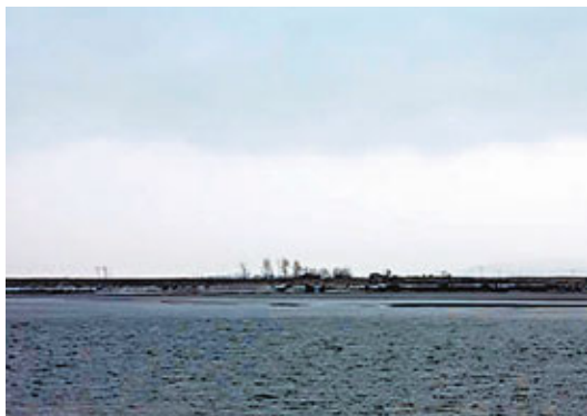
中朝邊境的威化島。