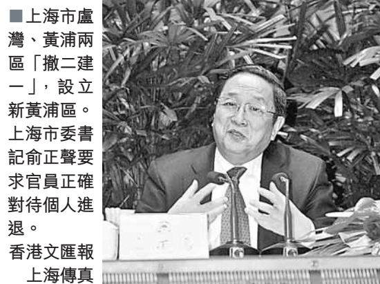
香港文匯報上海傳真

俞正聲表示,要堅持依法辦事,嚴格執行法律法規,認真履行法定程序,保障各項工作依法有序進行,要統籌協調將撤二建一和區縣換屆工作有機結合,嚴格按照換屆工作要求,做好領導班子配備工作。各級黨組織要切實加強思想政治工作,確保幹部隊伍的思想穩定,要倡導大家正確對待個人的進退流轉,切實防止自行其是、突擊提幹等問題的發生。