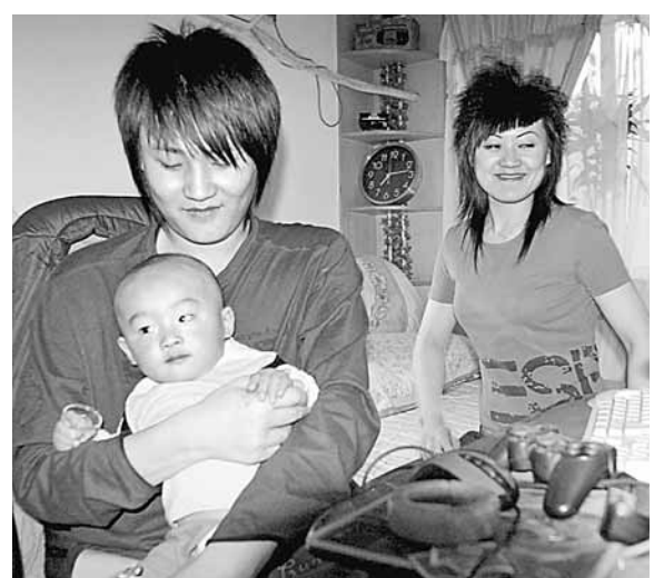
社科院專家倡微調計劃生育國策,讓夫婦二人其中一人是獨生子女的家庭也可生育兩個孩子。資料圖片

香港文匯報訊(記者 何凡 北京報導)全國人大常委、中國社科院經濟學部主任、學部委員陳佳貴8日向本報記者指出,建議循序漸進、分期分批對現行的計劃生育政策展開微調。按照當年的政策預期,該政策已經基本成功完成歷史使命。他透露,微調方案包括首先由上海等戶籍人口負增長的大城市放開,並分三步逐漸過渡至完全放開生育二胎。