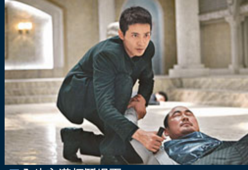
全片充滿打鬥場面。