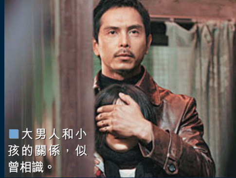
大男人和小女孩的關係，似曾相識。