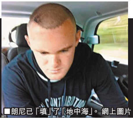
■朗尼已「填」了「地中海」。

未老先「禿」的朗尼上周接受了植髮手術，這位25歲曼聯前鋒日前在Twitter上展示了自己花費3萬英鎊(約37萬港元)植髮後的首張照片，他寫道：「大家好，這是我的新髮型。頭髮還需要經過幾個月來生長。手術後的傷口還有點血腥，但這是正常的。」