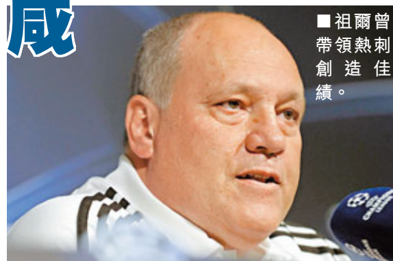
■祖爾曾帶領熱刺創造佳績。