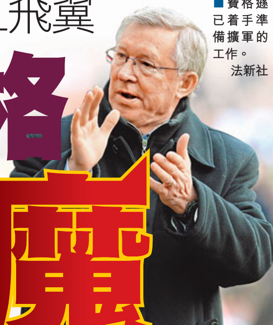
■費格遜已着手準備擴軍的工作。

紅魔去年斥資逾2億港元簽下小豆、基斯史摩寧與碧比3員新人，今年夏天，他們終於有具名氣的球星加盟。多份英國報章都透露，阿士東維拉的25歲翼鋒艾舒利楊格將會加盟紅魔，轉會費約為2000萬英鎊。擁有過人速度與突破能力的艾舒利楊格，總共為維拉上陣193場，入了39球；代表英格蘭出戰15場，有2球進帳。