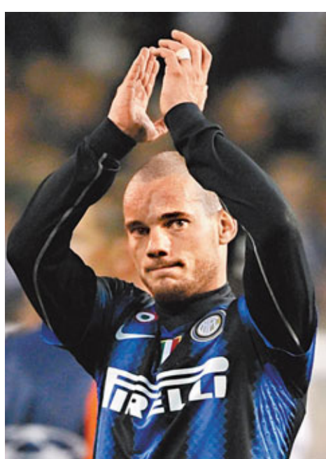
■史奈達有意赴英超。

2004至07年執教熱刺期間曾帶領該球會殺上第5名亮相歐協盃(歐霸盃前身)的荷蘭教頭祖爾，昨日正式跟富咸簽約2年，成為該英超球會的新任領隊。這位07年因績差被熱刺解僱後執教過德甲漢堡的55歲教頭半年前辭去阿積士主帥之職，今次重返英超，在曉士跳槽後接掌富咸兵符，他說：「富咸是間擁有堅實基礎與龐大球迷群的好球會，我期待成為富咸大家庭的一員，並感謝主席對我的信任。」