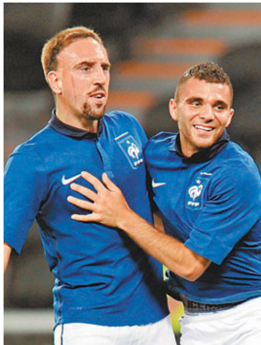
■馬雲馬田(右)搶盡風頭。

上周歐洲國家盃外圍賽，主力隊員狀態低迷的法國隊只能與白俄羅斯踢成1:1，主帥白蘭斯昨晨在足球熱身賽遂遣10名副選隊員上陣，結果法國作客大勝烏克蘭4:1，敢於提拔新人的白帥顯示了鐵腕治軍的決心，且近9場比賽保持不败。