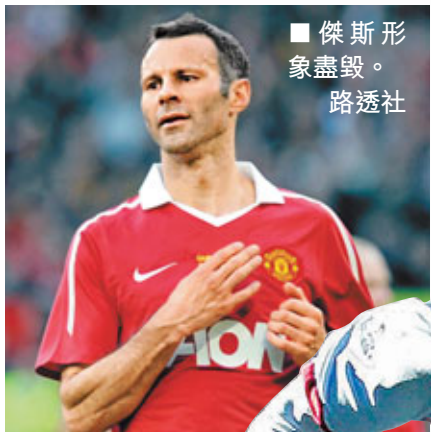
■傑斯形象盡毀。

曼聯球星傑斯的性醜聞越鬧越大！英國傳媒披露，除了威爾斯小姐湯瑪絲和弟婦娜塔莎外，傑斯的偷食名單上還再添了一名女子，但其身份卻仍然成謎。據悉，28歲的娜塔莎上周接到一個神秘電話，電話中女子宣稱「娜塔莎並非唯一和賴恩(傑斯)有性關係的人」，娜塔莎有感被37歲的傑斯玩弄，遂決定向朋友和老公羅德里公開與傑斯長達8年的姦情。