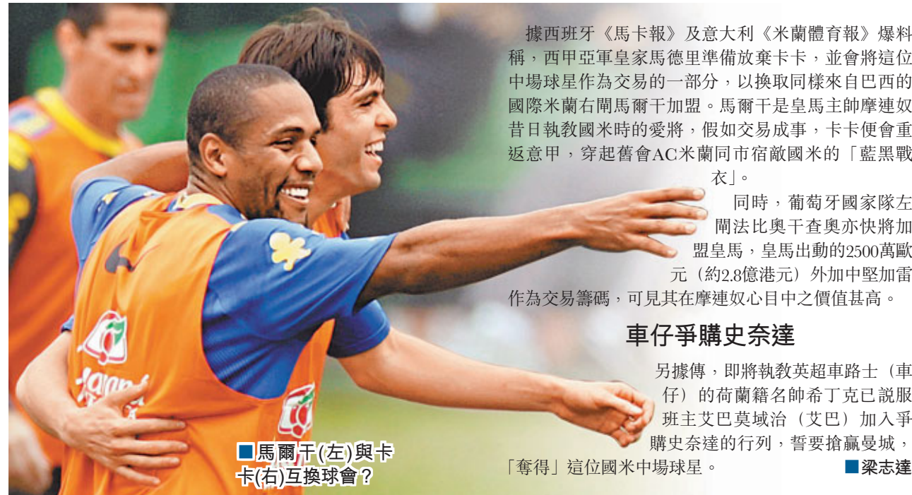
■馬爾干(左)與卡卡(右)互換球會？

據西班牙《馬卡報》及意大利《米蘭體育報》爆料稱，西甲亞軍皇家馬德里準備放棄卡卡，並會將這位中場球星作為交易的一部分，以換取同樣來自巴西的國際米蘭右閘馬爾干加盟。馬爾干是皇馬主帥摩連奴昔日執教國米時的愛將，假如交易成事，卡卡便會重返意甲，穿起舊套AC米蘭同市宿敵國米的「藍黑戰衣」。