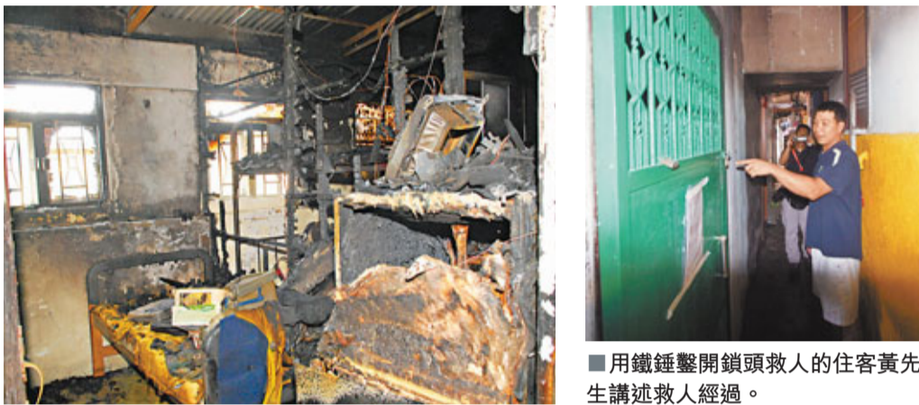
■被縱火天台屋嚴重焚毀。