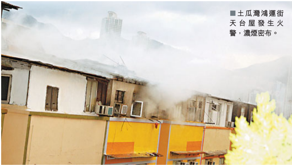
■土瓜灣鴻運街天台屋發生火警，濃煙密布。

消防員接報到場開喉灌救，約20分鐘後將火撲熄，但起火天台屋已嚴重焚毀，幸無波及鄰居。消防調查後相信火頭在事主的隔壁單位，並在現場檢獲一個火水罐，由於上址居民多使用罐裝石油氣，認為火警起因有可疑，交由警方列作縱火案調查。